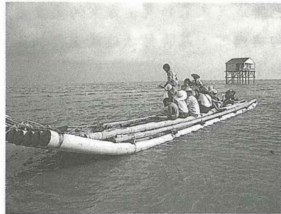
發展休閒漁業，建設富麗漁村。