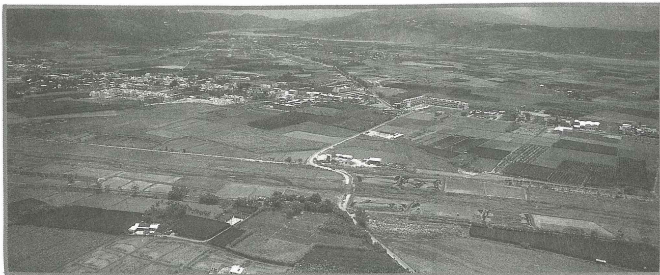
徹底執行 農地農用。