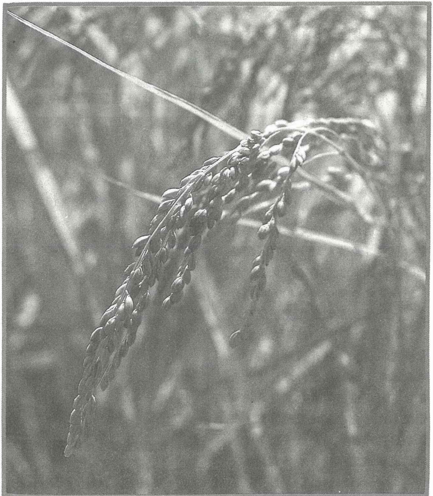
稻米生產將以供需平衡為目標。

2. 稻穀、雜糧保證收購方式與收購價格、數量暫不調整，為達成削減境內支持20%之目標，將優先調整雜糧種植面積與收購次數，倘短期內無法達成削減目標時，研擬調整保證價格收購制度，實施符合GATT規範之直接給付措施。