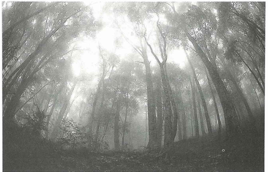
國有林由中央設置專責機關直接管理經營。