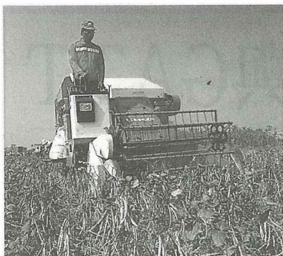
建立農民年金保險制度。

促進農漁村社區更新與建設；並積極推展農漁村文化，提升農漁村生活品質，以利城鄉均衡發展。