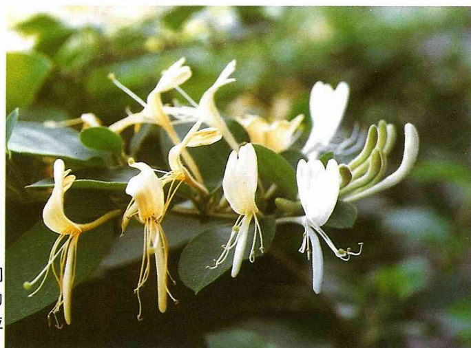
在金銀花的樹枝上可同時看到白色和金黃色的花開放，如同金、銀並列。

前面10則的香花植物系列，介紹了蘭科、球根類及木本的香花植物，為免遺珠之憾，其他常見的香花植物，將擇要歸納成藤本香花植物及草本香花植物，以兩期的篇幅來介紹。