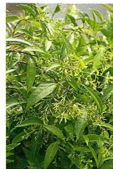
當夜幕低垂時，夜香木萬花齊開，發放濃郁的香味，放肆、熱情而又十分有個性。

在台北街頭有一處茶藝館以紫藤為名，也以紫藤為號召，吸引了不少的消費者，除了因為紫藤優美的花形外，也因為它那近乎浪漫的名稱。紫藤屬於蝶形花科、紫藤屬，原產中國、日本及北美洲。為落葉性大藤本；葉互生、奇數羽狀複葉，小葉全緣，葉有柄及小托葉；花為總狀花序，頂生、長達30~60