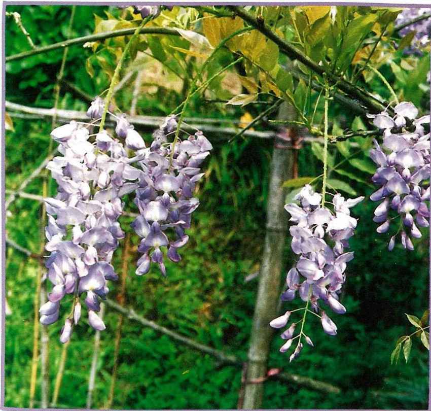
浪漫優雅的紫藤，不但是良好的花廊植物，花瓣還可拌麵粉蒸熟，食用齒頰留香。

多。當夜幕低垂時，萬花齊開，發放濃郁的香味，放肆、熱情而且十分有個性，喜歡它的人說它濃香醉人，不喜歡的人簡直受不了它濃得近乎臭的氣味，宛如打翻了廉價香水般令人無法忍受呢!!