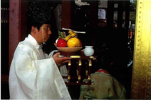
水果，新綠秧苗，祈求及舞蹈 交織而成神明眷顧農地的畫面