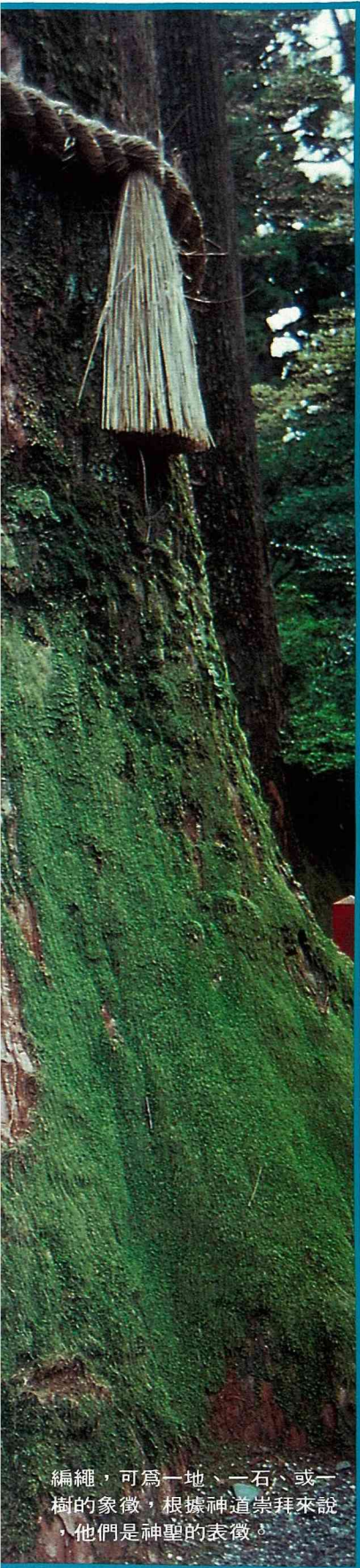
編繩，可為一地、一石、或一樹的象徵，根據神道崇拜來說，他們是神聖的表徵。