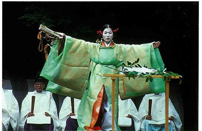
孜孜不倦的女祭司神聖地舞著，此在 通靈時有些像薩滿教的儀式。

我們在高處瞥見古老的朱漆木柱，總數約有一萬隻，每一隻柱廊上都題有捐贈者之名，幾世紀以來，它們一直忠實地堅守崗位，形成了一個奇異的隧道，它讓朝聖者能經此直通山巔。在Fushimi Inari朝聖也因此變成了一種體能運動。第一次禱告是在神殿入口進行，之後在每個祭壇前暫停一次，並重新禱告。最英勇的人兩小時即可完成全程。他們或是直攻山巔或是只到最後一個有狐狸看守的祭壇。