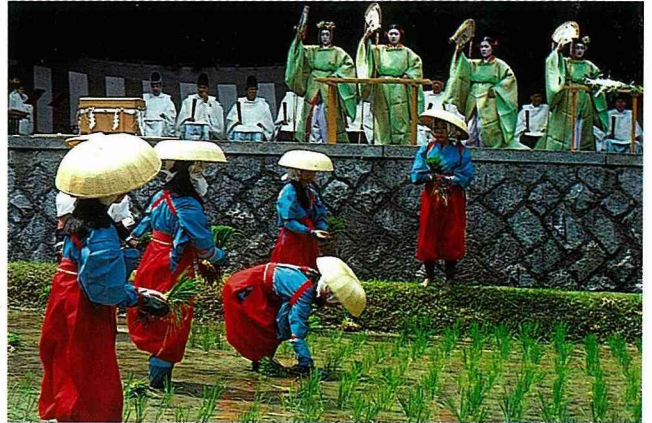
聖田是宗教、農事、神聖舞蹈 以及栽種者的會合點。