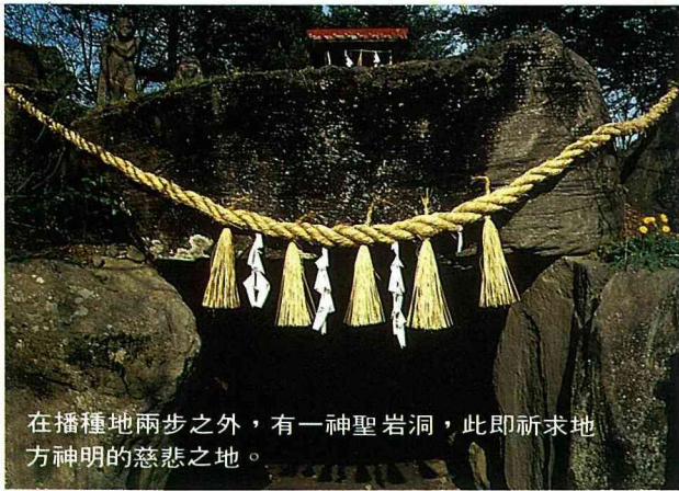
在播種地兩步之外，有一神聖岩洞，此即祈求地方神明的慈悲之地。