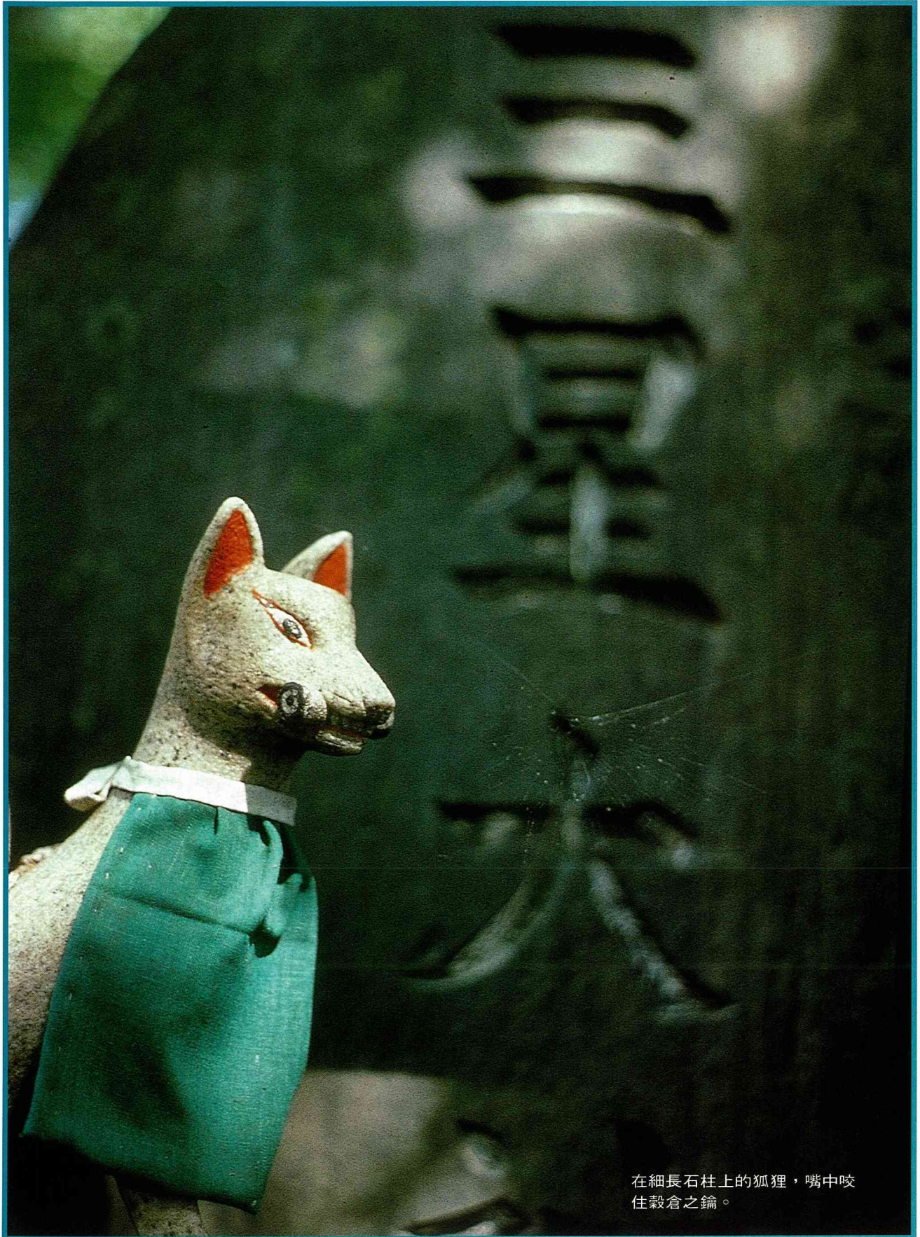
在細長石柱上的狐狸，嘴中咬住穀倉之鑰。