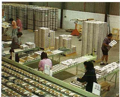
奇異果包裝工廠一隅。

這種棕皮綠肉的水果會被易名為「奇異果」(Kiwifruit)，也是其來有自。因為它的外型