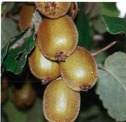
結實纍纍的奇異果藤蔓。

觀瘦小毫不起眼，只有獼猴之類野生動物肯吃的果實，竟然反倒是「枳逾淮而為橘」；飄洋過海到了紐西蘭後，一經過改良，遂變成渾厚多汁的模樣，甚至還異軍突起，在世界農產品市場中展露頭角，為紐西蘭賺進大筆外匯。美國加州果農隨後跟進，利用