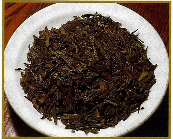
82年杭州西湖獅峯的龍井冠軍茶外觀。

我 國是最早發現和利用茶葉的國家，全世界最高齡的原生茶樹也在中國的雲南勐海境內，據估計樹齡已有1700年之久。目前栽培育種可掌握的品種至少已有500多種，再加上各地持有的品種，我國的茶資源直可成為一個茶種的萬國博覽會。