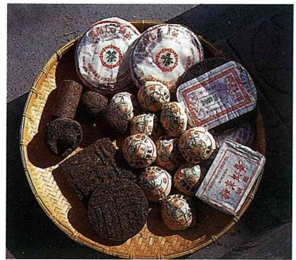
各式不同的普洱茶。

十元，但市場上可因年份別而炒作到上千元。七子餅茶以7片一捆為包裝，年輕的一片100元上下，40年以上的往往索價數千元。像民國初年生產的普洱其包裝紙是紅色油墨印製的，因此有稱「紅印普洱」的，一片索價近萬元，其堆放年代加上保存至今可能有90年或上百 years 了。另外還有