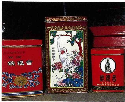
大陸鐵觀音的外包裝。

水仙、台灣烏龍及台灣包種最具代表性，尤其是武夷岩茶系列最富盛名。武夷山為天然的植物園，茶樹種類極多，遠在西元1023年已充「官茶」列為貢茶。武夷的名茶有一種特別的「岩韻」，行家一喝便知真假。岩茶中有許多品類，其中以4大名巖最為名貴，分別為有許多傳說的大紅袍、鐵羅漢、白雞冠與水金龜。10餘年前，我有幸於一父執輩家中嚐過大紅袍，據說當時的價格為1斤港幣3萬8千，合台幣約27萬元。近年來由於開放探親，有些親友帶回來許多大紅袍，不知是人為因素還是商業手法，目前的大紅袍滋味已不如當年，我想市面上想買到的機會恐怕很難。至於武夷名茶中的肉桂、半天我倒嚐過，很有特色，目前還留有少量茶葉做為樣本。