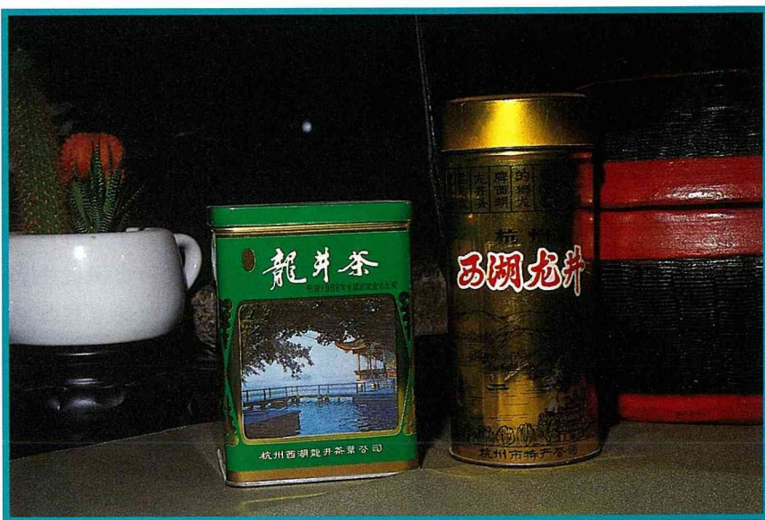
大陸龍井茶的外包裝。

白茶為輕微醱酵的茶類，其基本製作過程為晾曬、乾燥。茶質特點為乾茶外表披滿白色茸毛，色白隱綠，湯色淺淡，味甘醇，只產我國。白茶的名茶有銀針白毫、白牡丹貢眉（壽眉），本島地區飲者甚少，市面上流通也不多，很少見到。由於白茶製作採茶葉新芽而且醱酵度輕微，因