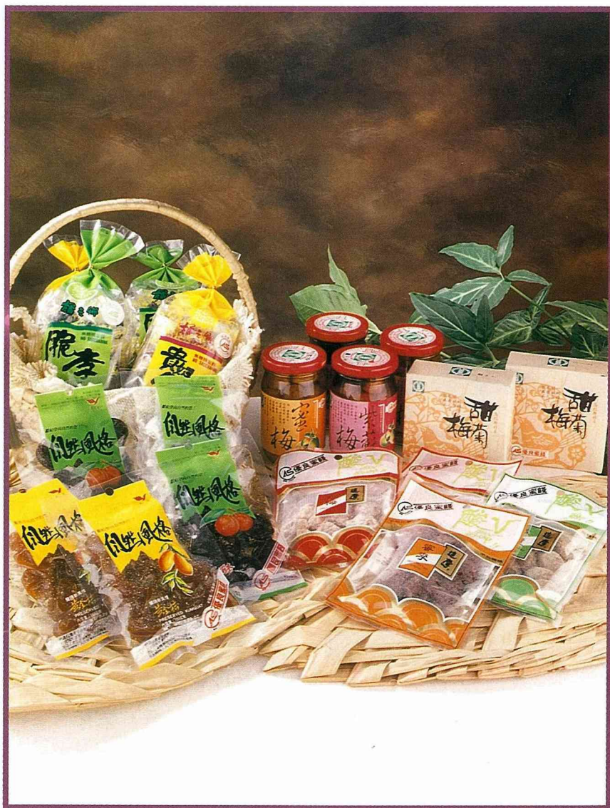
密閉式包裝上有正確標示的蜜餞產品

示規定與檢驗分析方法等。並依據手冊，於當年6月及12月，分別舉辦業者說明會，由蜜餞業先申請輔導，協助規劃改善後，再申請「CAS優良蜜餞標誌」，截