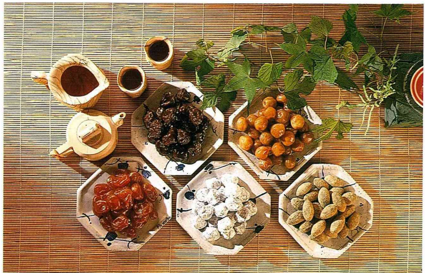
衛生安全的CAS優良蜜餞

者採觀望之際，即有業者表示「我們工廠生產蜜餞的原則，一向是我不敢吃的，絕對不給別人吃」，具有孔子「己所不欲，勿施於人」的精神，不惜投入資金，增設日晒屋，改善衛生環境，甚而有不惜耗費巨資重建新廠，使CAS優良蜜餞更多了一層保障。