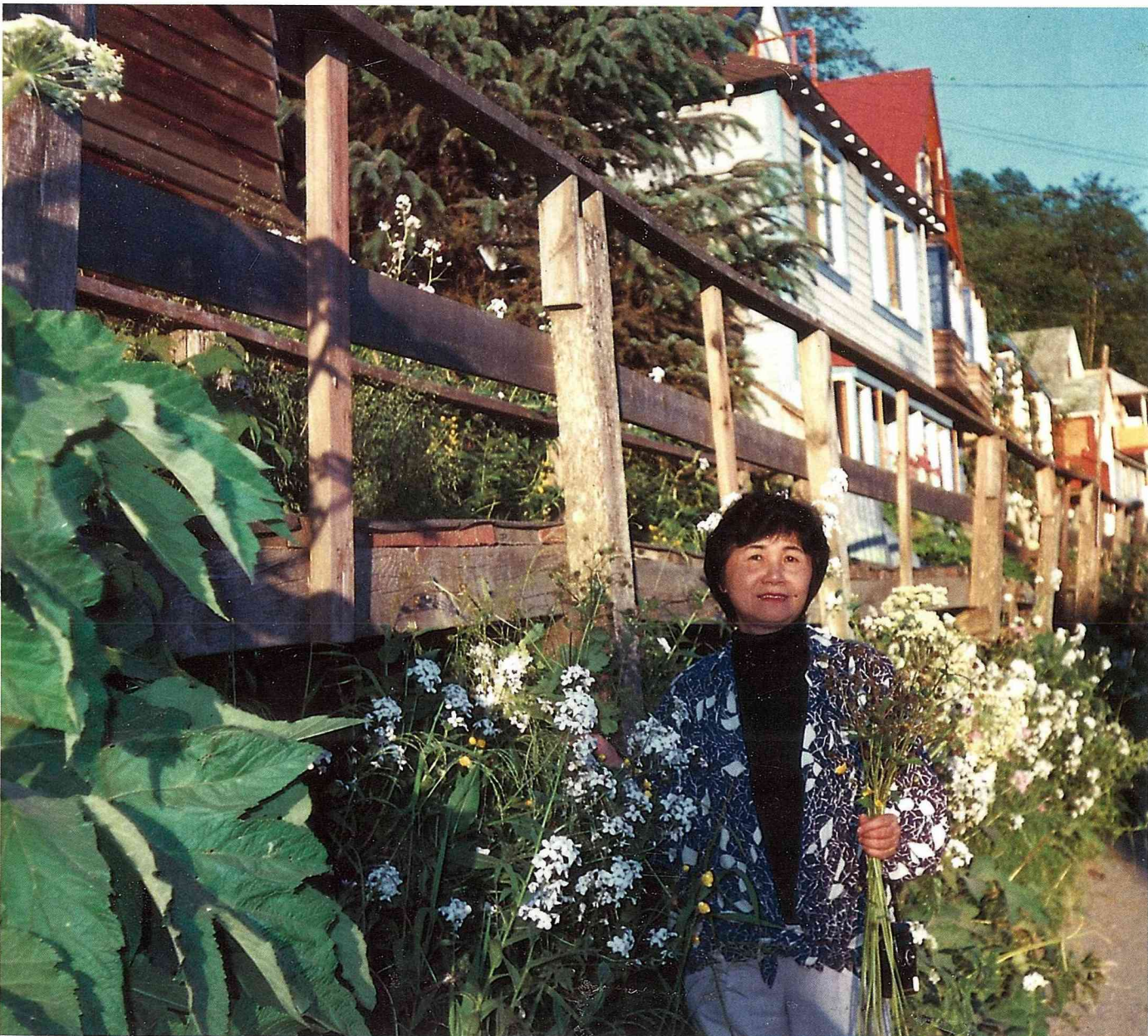
在阿拉斯加的小島上，路旁的小花可做乾燥花素材。