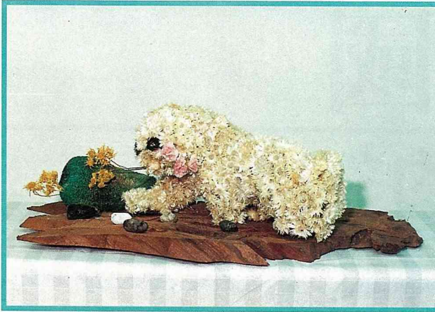
乾燥白菊做的北極熊