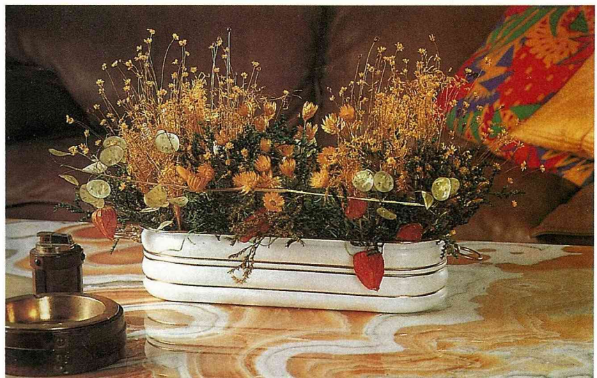
充滿亮麗色彩、歡愉氣息的作品。

人不愛，為什麼我會特別喜歡乾燥花呢？這是因為：1983年春，一個偶然機會裏，在美國的底特律開啟了我對乾燥花的興趣，之後，我便巡迴世界各地展開了乾燥花的尋根之旅。此外，我好奇的個性也是因素之一，乾燥花令我被其獨特的魅力深深吸引住。其次，漂亮的生花最多不過維持10多天，且還需經常換水，忙碌的現代人是無暇勤換水與整理的。