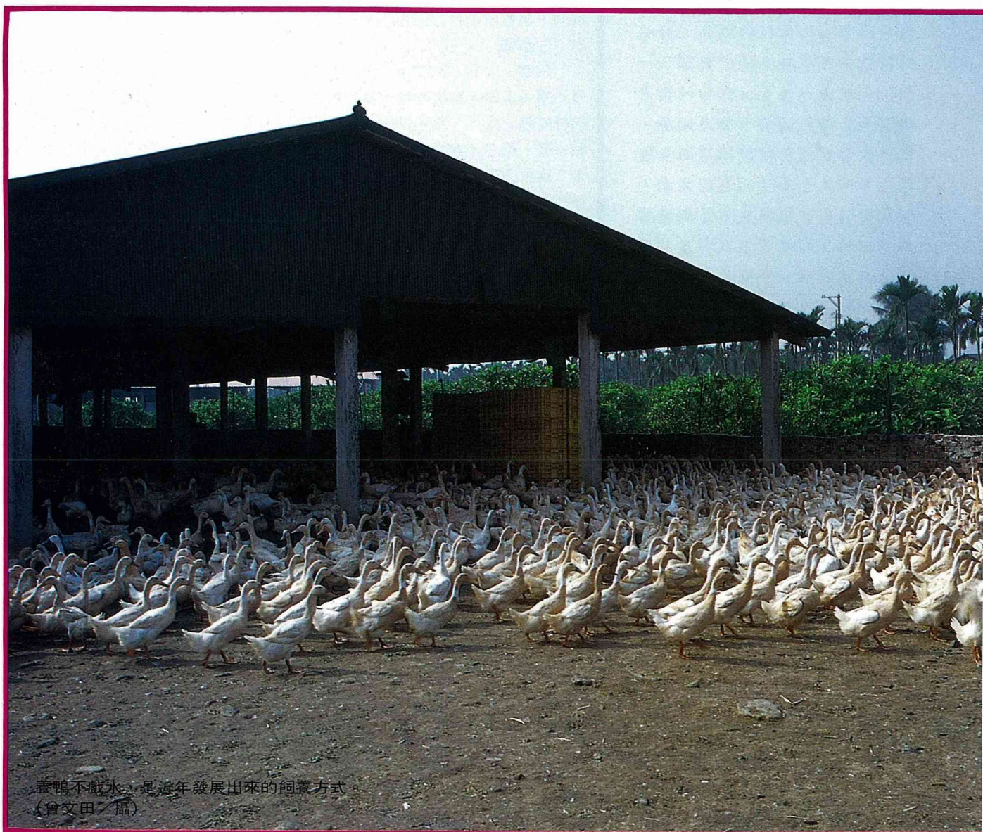
養鴨不撒水，是近年發展出來的飼養方式。

國產鴨肉的肉質與風味獨具特色，國人對鴨肉、鴨蛋的喜好也有別於歐美，因此在面臨貿易自由化，美國禽肉扣關頻頻的壓力下，養鴨產業所受衝擊較輕，似仍得以獨樹一格，展望未來。然而，提高生產效率，兼顧環境保護，加強競爭能力，提升產品品質，消費管道現代化及開發多樣化二次加工品等，是台灣養鴨產業能否覓得生存空間之先決條件。