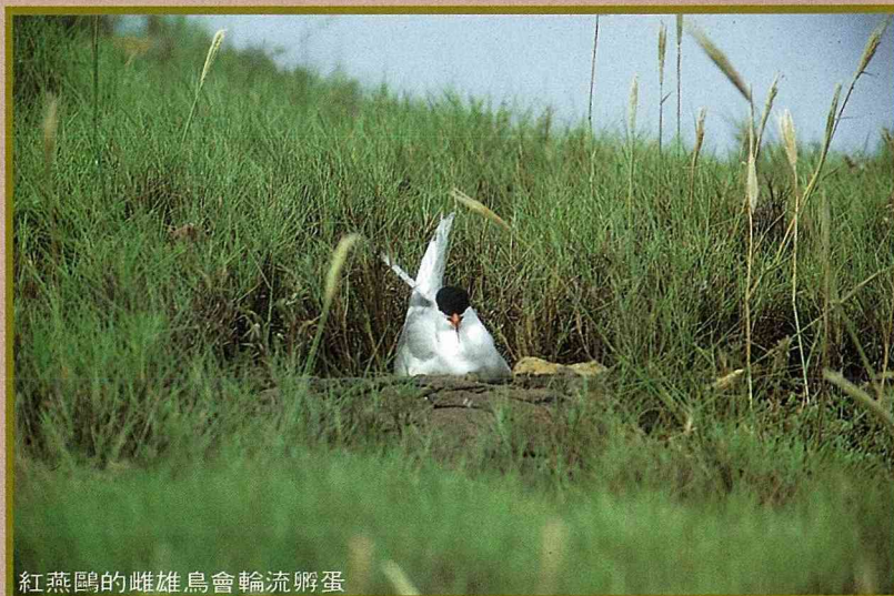
紅燕鷗的雌雄鳥會輪流孵蛋

燕鷗的蛋為食物，以及獵殺燕鷗，用它們的飛羽來裝飾婦女的帽緣，而導致北美洲的燕鷗族群急遽下降。經過保育人士多方的奔走，並由立法的程序，才一一將各種瀕臨絕種的燕鷗族群救回。