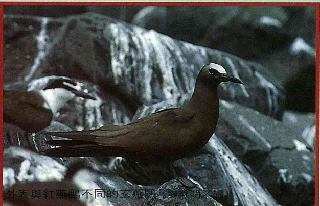
外表與紅燕鷗不同的玄燕鷗