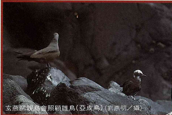
玄燕鷗親鳥會照顧雛鳥(亞成鳥)

大鬍子劉燕明頂著盛夏大太陽，在澎湖拍攝燕鷗紀錄片。他必須忍常人不能忍，拍這部影片，他先後換了8位助理。