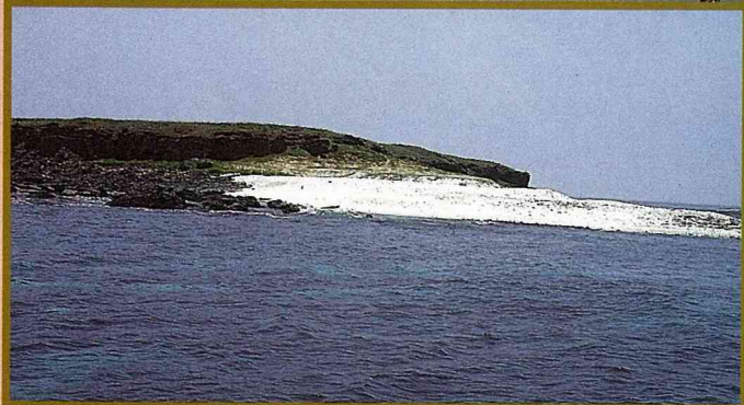
澎湖的某個無人島是紅燕鷗的棲地。