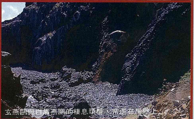
玄燕鷗與白眉燕鷗的棲息環境，常築在崖壁上