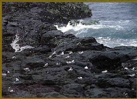
燕鷗是群聚性候鳥

之而來的卻是更多的擔憂與氣憤！在無人島上發展觀光、建旅館、蓋停機坪的字眼不斷出現在報端，保育的聲音被壓抑至最低。我們知道這些開發一旦進行，燕鷗就會不見了，待觀光的熱潮退燒，台灣也將從千百年來燕鷗傳承的遷徙地圖上擦去，逐漸淡忘。我們希望政府能重視本土的野生動物保育，「追逐夏日的鳥——台灣的燕鷗」這部紀錄片能為燕鷗的保育留下鮮活的見證，而不是悲哀的為這群台灣後代子孫再也看不到的鳥劃下句點！