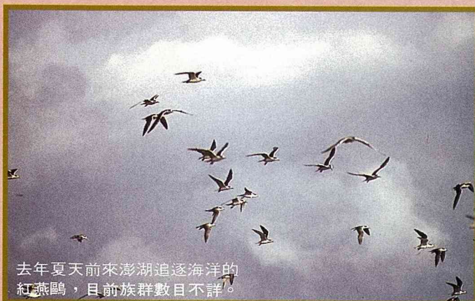
去年夏天前來澎湖追逐海洋的紅燕鷗，目前族群數目不詳。

心中哀悼著這些原本可以發育成混身斑點，也有著小小蹼的雛鳥，生命本不該是如此的！近年來，基隆的鳥友在北方三嶼的棉花嶼及花瓶嶼上也紀錄到燕鷗的繁殖，這些消息令我們興奮，但隨