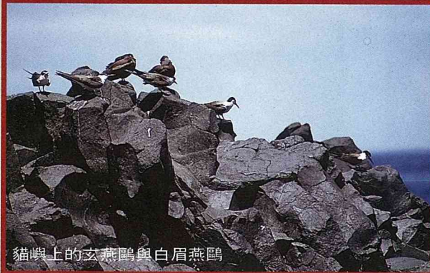
貓嶼上的玄燕鷗與白眉燕鷗