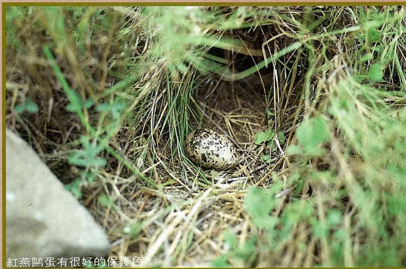
紅燕鷗蛋有很好的保護色