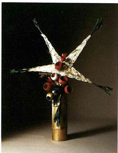
慶祝德國統一的作品

的，顏色大多是鮮明而柔和，給人親切的感覺。平靜無紋的小湖襯上遠處潔白無瑕的白雪山頭，真讓人忍不住的就想親近她。瑞士的乾燥花作大小互現，大多是小品花為主，但在旅館大廳也有以馬車為花器，裝飾成雄偉矗立的作品。而花材則以小花為多，這個作品的花材多是我從瑞士採集回來的，我用不少顏色來表現瑞士春天的野外，紫色代表高貴、鵝黃是溫柔、橙色是活潑、粉紅是可愛、白色是純潔、綠色代表和平，加上細緻的小車，彷彿感受到瑞士和煦的春風。