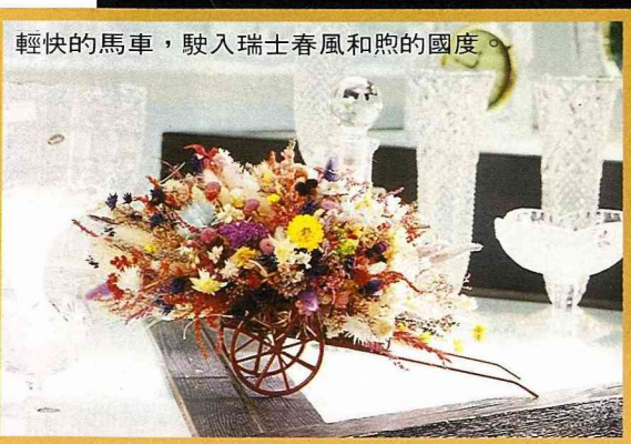
輕快的馬車，駛入瑞士春風和煦的國度。