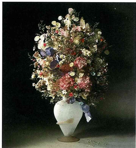
代表法國的作品，您是否也感受到花都的浪漫？

義大利、西班牙、荷蘭是歐洲主要的乾燥花製造國。義大利和西班牙的花材以穗類及小花朵為主，色彩柔美、細緻優雅；荷蘭的24小時完成的乾燥花快速乾燥法，使經處理的花朵仍保持和鮮花相同的美艷色澤。