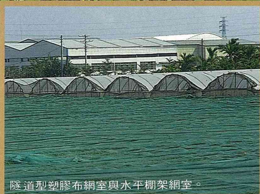
隧道型塑膠布網室與水平棚架網室。

設施蔬菜產銷班都有專家指導農藥使用，栽培技術與有機質肥料施用，產品安全可靠。消費者前往超市選購網室蔬菜，比較有保障。