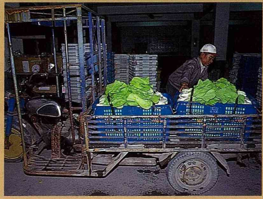
永靖鄉設施蔬菜以供應中北部超市為主。