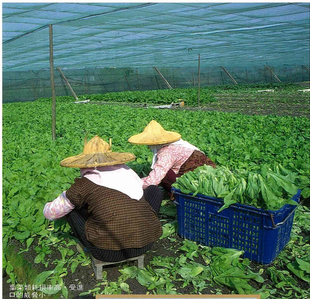
葉菜類耗損率高，受進口的威脅小。

今年63歲，專業經營設施蔬菜有10年栽培經驗，自己種菜7分多地，研究班種菜面積15公頃以上，都是設施蔬菜，包括塑膠布網室和簡易網室。蔬菜種類有小白菜、青江菜、油菜、刈菜、茼蒿、菠菜、芹菜、萵苣、空心菜、紅鳳菜等。銷售管道是與台糖公司合作，走中北部超市路線，例如台北的松青生鮮超市；台中、斗六、斗南的丸久生鮮超市。班員栽培意願高，彼此密切配合，長期以來都作好產銷計畫與市場調查，才能保障班員利潤。