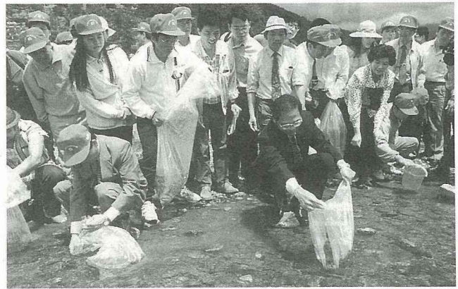
野生動物保育——南澳南溪魚苗放流

及巷道雜草叢生，影響社區整潔景觀及漁民生活品質。經本府、頭城鎮公所、頭城區漁會及該地區發展協會為致力提昇漁民生活品質，承蒙中央、省府補助完成社區公園1處1,000m 2 、涼亭1處，以提昇漁民休憩及活動空間，並將巷道全面綠化美化，使得社區景觀煥然一新，對改善漁村生活環境品質助益頗大，值得大力推展。