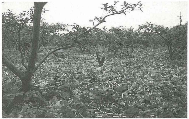
員山鄉果樹自然生態法經營示範——果園植栽綠肥。