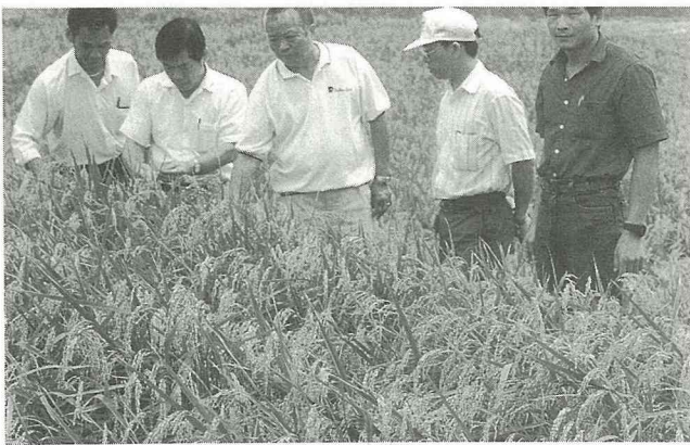
強化良質米產銷計畫——田間勘查