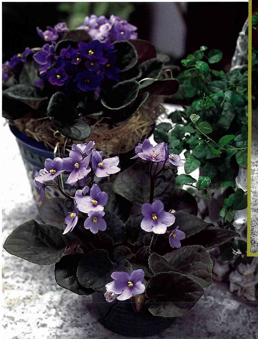
紫色茂盛的非洲堇，放入手拉胚荷盆，置於案頭帶來滿室的清新。

紙，襯托出肥厚多汁的葉片，捉把上再別個精緻的緞帶，贈送給愛花的朋友，不失為一項好禮。