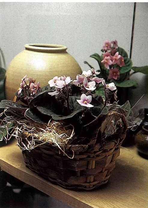
淡雅柔和的粉色非洲堇，配上木屑和藤籃，寂如森林中的小花。