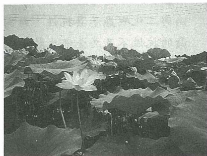
稻田轉作地區性特產—蓮子

輔導專業農民設置代乾燥中心48處、代耕中心112處、育苗中心55處；在建立企業化農業生產區方面，本縣劃分為516個生產區段，由76年度開始實施，至83年度止，辦理區段面積達3萬5千多公頃，並組織各類型共同產銷經