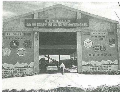
農牧廢棄資源處理中心