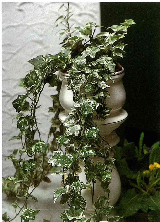
歐式風格的花瓶放入懸垂的美斑常春藤有貴族的氣息。