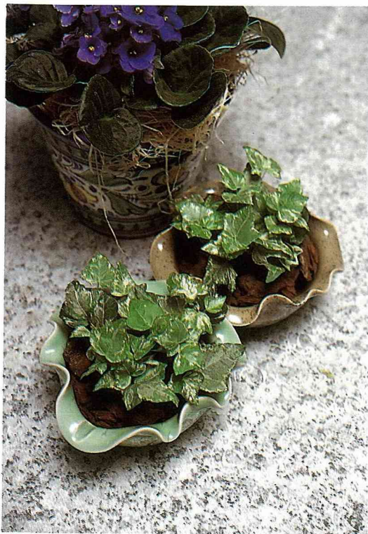
常春藤種植於荷碗中，鋪上樹皮，小巧玲瓏而別緻可愛。

時 序即將邁入盛暑，在炎炎日光下，看著垂掛在窗邊的常春藤隨風搖曳，婀娜多姿、綠蔭清涼，真是一種享受。常春藤原產於北非、歐洲、亞洲溫帶或亞熱帶，原生種約有5種，但變種和栽培種卻有非常多，葉色、葉形變化多端，而美麗的葉，優雅似楓，在這初夏的時節，帶來了秋的涼意。