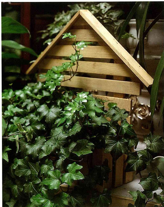
蔓綠常春藤放入小木屋狀的壁飾，像是森林中的小木屋，帶來滿室的沁涼。