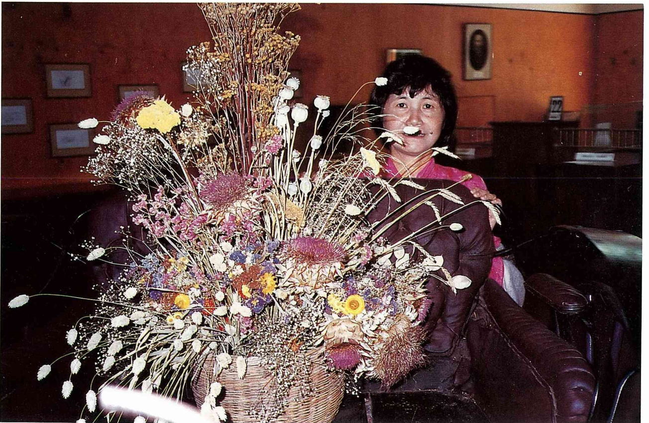
澳大利亞的野花作品—兔尾草。