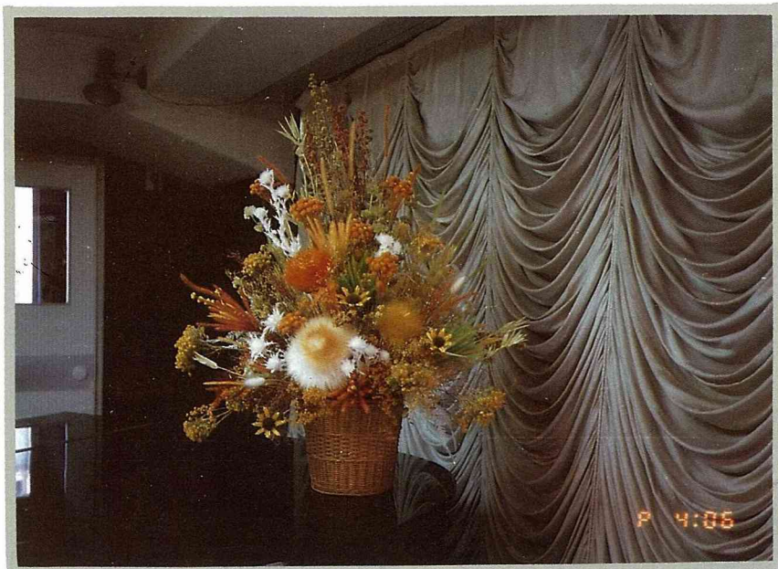
澳洲風情—以澳大利亞花材完成的作品。

、安祥的感覺。兔尾草原產於地中海，卵形花序，圓錐形絨毛花穗，像初生嬰兒的金髮，輕柔可愛，成片生長遠看有絲緞般光澤，乾燥後更是常用的花材。