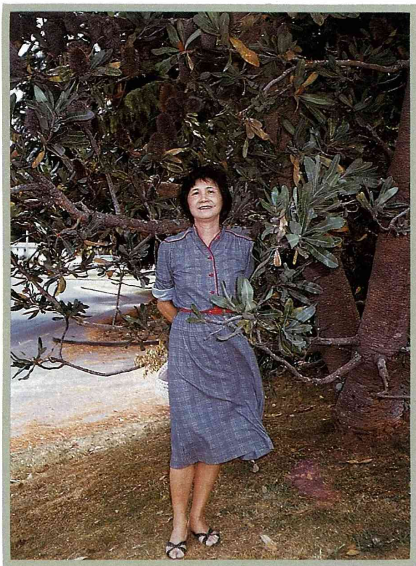
佛塔樹，澳洲的公園、街道到處可見。