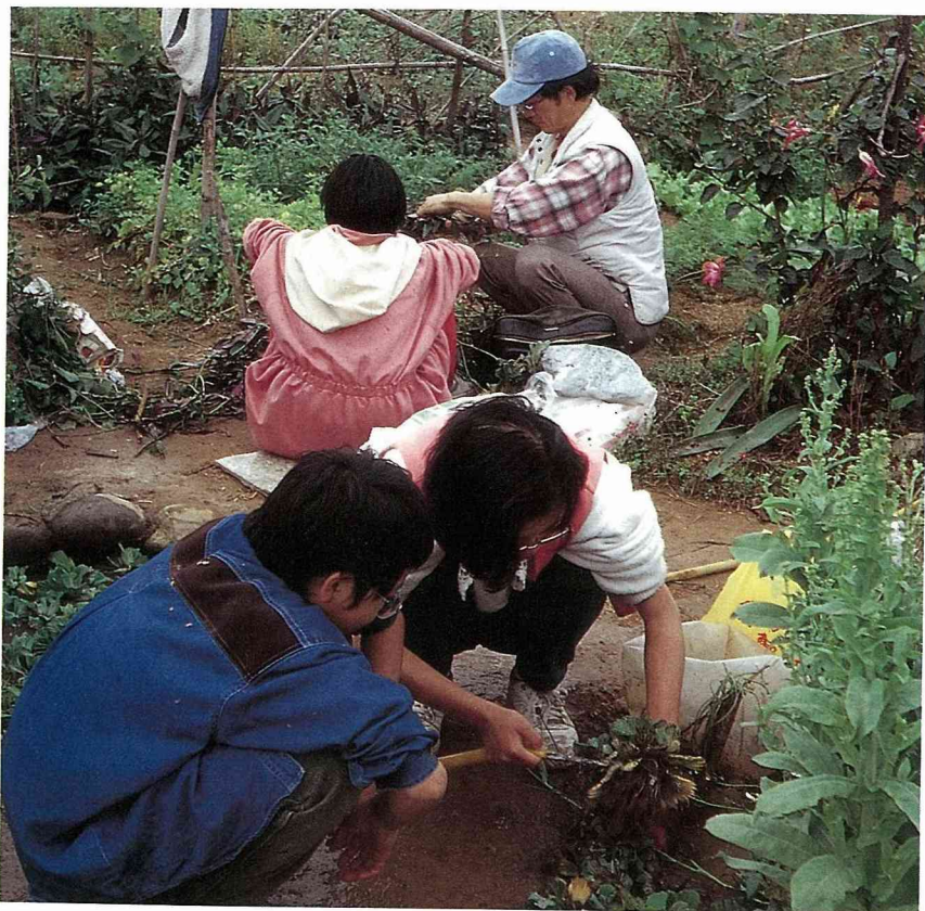
來市民農園種菜成爲劉家最好的假日休閒活動。

龍潭鄉市民農園成立至今已滿一年了，承租人在辛勤撒種後，享受到歡喜收割之樂，參與非常熱烈，而農會的工作人員在范總幹事德財和推廣股張股長良琪的領導下積極投入各項軟硬體的建设中，范總幹事對這一年來的實施成果深表滿意，也希望能服務更多愛好自然的人，大家一起來和大自然做好朋友。