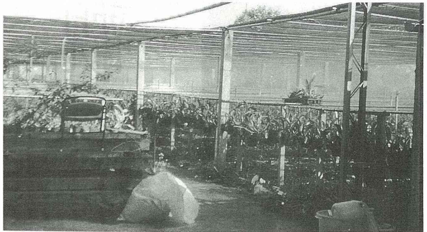
設置自動噴水設備，改善花卉產銷班生產環境。

(二)改進花卉產銷：加強花農組訓，召開產銷班班會4次。改善生產環境設置自動噴水系統0.1公頃，簡易設施溫室0.1公頃，購置自動噴霧機2台與綠籬剪1台。