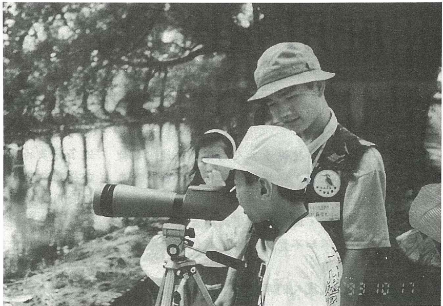
舉辦賞鳥活動宣導野生動物保育理念。