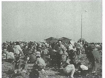
推廣農村生態綠化，舉辦親子植樹活動。

(三)加強豬主要傳染病防治：辦理養豬戶豬病防疫宣導講習及觀摩會，督導養豬研究班班長舉行豬隻衛生檢討活動。