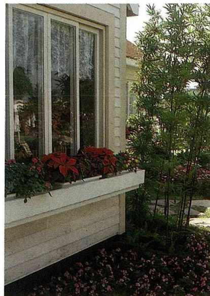
木製花架配合花槽，以混植的方法種植，一個花槽中種上4、5種以上的草花，活潑又富趣味。如果配合應節盆花，更顯熱鬧。