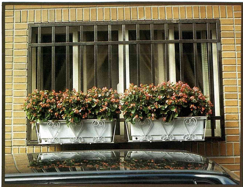
台北市一戶人家的窗外，只用簡單的鐵絲花架鉤掛花槽，雖然只有二槽但屋主每次都只選用單一花種，簡單熱鬧又好管理，是很好的範例。

鬆不費事又達到美化環境的效果呢？第一步是要找一把尺，先量一量自家所有窗戶的寬度，記在紙上。第二步算一算可以放多少個花槽，一般國內生產的花槽約70公分以內，所以用70公分為單位來換算。最好看的花槽長度是比窗台左右各多出30公分，舉例來說，如果窗戶寬180公分加上60公分，除70公分為3.4，去小數點尾數，也就是最少可放3個花槽。如果安全許可，放2排，就能放6槽，而花槽架的長度應