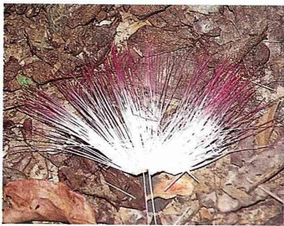
清晨時，雄蕊不經枯萎即掉落地面。

棋盤腳的花期在每年的5~10月，但極端可延至12月底。當仲夏夜幕低垂時，每一朵花就等待著吐訴造化的神奇，當其內捲花絲慢慢伸出時，花粉已釋放。