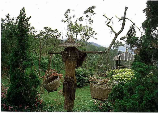
香格里拉農場 有規劃優美的觀光果園、菜園及烏心石林。