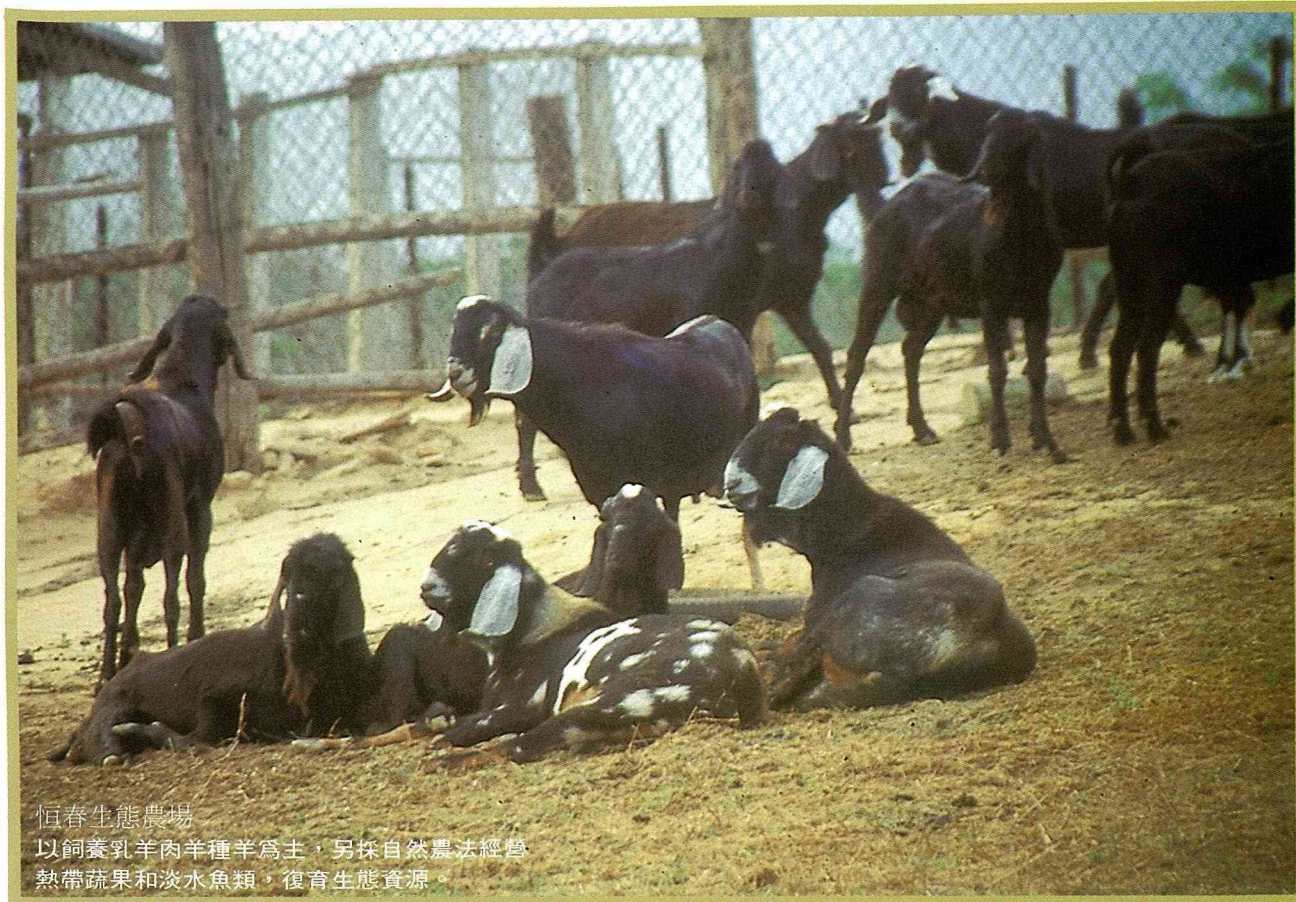
恒春生態農場 以飼養乳羊肉羊種羊為主，另採自然農法經營 熱帶蔬果和淡水魚類，復育生態資源。