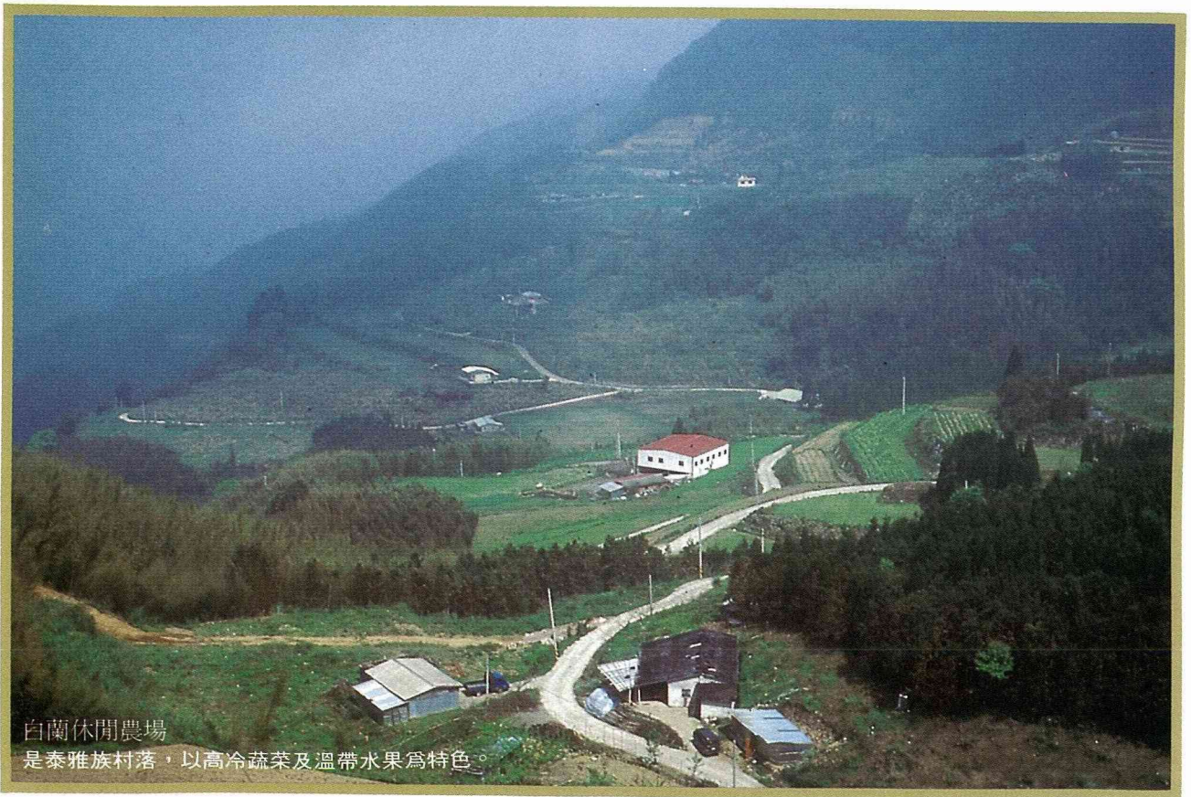
白蘭休閒農場 是泰雅族村落，以高冷蔬菜及溫帶水果為特色。

經九份或侯硐走雙溪線抵達。農場以生產小面積的高苣、空心菜、紅鳳菜、高麗菜等健康蔬菜。水果有西瓜、蓮霧，爲了做好水土保持，近幾年來約種植上萬株的楓、樟、梅及櫻花樹。本場一直致力圓一個兒童甜蜜的農家夢，特別設置一系列的農業體驗設施，歡迎閤家光臨，親子同樂。農場提供餐飲、住宿。附近旅遊點有丁蘭谷、十分瀑布、草嶺古道、九份古蹟。