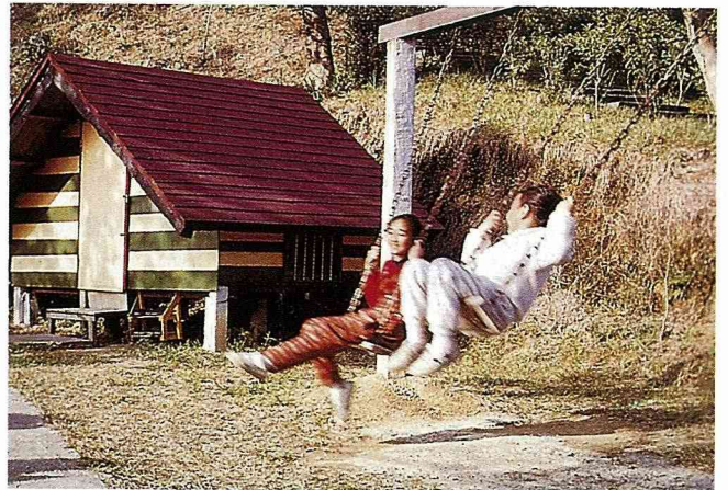
慈暉休閒農場 致力於圓一個兒童甜蜜的農家夢。