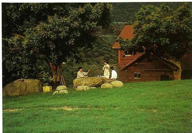
森山休閒農場 世代以種植果樹為生計，充滿閩南風味。