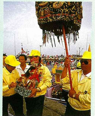
在綵傘下，恭請神明上船。