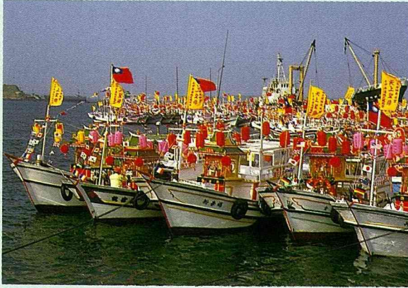
媽祖船隊，一片旗海。