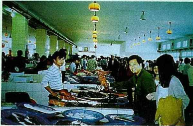
假日魚市有3處已正式開辦。