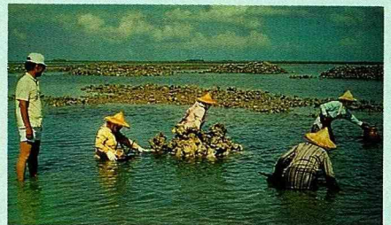
碇砧堆是澎湖特有的捕魚陷阱。