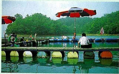
塭釣在本省有10萬餘名釣客。