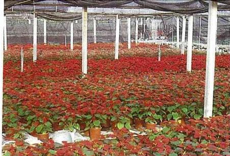
聖誕紅是國內生產銷售第一位的盆花