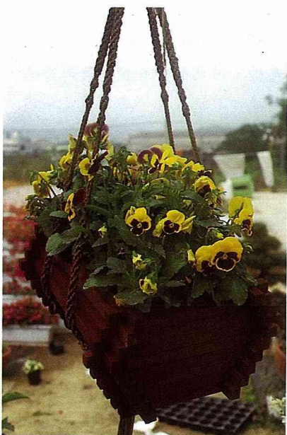
三色堇用加州紅木盆栽栽植，配合麻繩製成的吊繩，天然原始的質材與花卉的細緻，產生極佳的共鳴。

吊 盆是一般花卉經常利用的方式，放置的地點不論室內或室外，種類不論是觀葉植物、盆花或草花，都很適合用吊盆來種植。吊盆的種類、質材、風格變化很多，加上植物的搭配，可真是風情萬種，有時隨風搖曳，給人輕鬆浪漫的感受，有如風中的精靈，閃爍著迷人的風采。而它最大的好處是不佔平面的空間，所以很經濟又能增加設計上的變