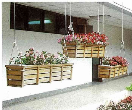
四季海棠和非洲鳳仙種在懸吊的木片花槽，像盪鞦韆一樣，充滿童趣的天真。

吊盆可以配合花槽架，使窗台或陽台充份利用三度空間，做立體化的利用，而且植栽也可以得到充足的光照，使生育及開花良好，延長草花的觀賞期，畢竟