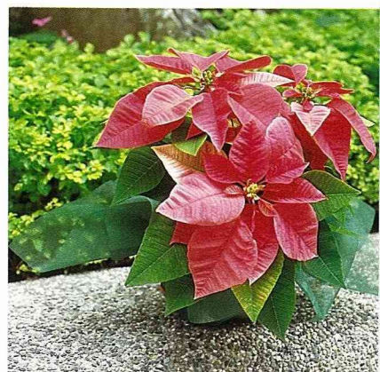
單盆聖誕紅配合簡單的包裝，就成了最佳「伴手」。

為了建立消費者和聖誕紅間的認識和友誼，今年度聖誕紅產銷協進會、台北市瑠公農業產銷基金會、財團法人中華民國花藝研推會、台灣省觀賞植物合作社及本場，在各地將舉辦聖誕紅消費促銷及展示活動，北部有兩次，11月24日～26日在新莊台灣省觀賞植物合作社，12月15日～19日在新光三越百貨公司舉行，歡迎消費大眾一起來領受聖誕紅的媚力與魔力。