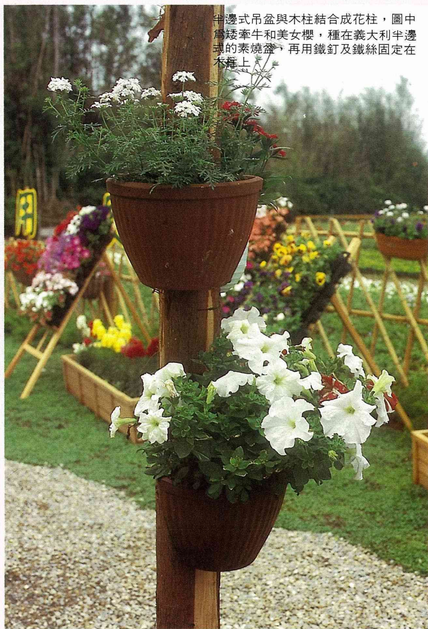
半邊式吊盆與木柱結合成花柱，圖中為矮牽牛和美女櫻，種在義大利半邊式的素燒盆，再用鐵釘及鐵絲固定在木柱上。

關業者及筆者的實際經驗，也許有些讀者會說我們是天生的綠拇指，所以做綠化美化時輕鬆愉快，成績斐然，是理所當然的事。其實後天的努力才是決勝的關鍵，因此不要怕失敗，怕是沒有從植栽的壯烈犧牲中學到經驗，那才對不起植物們一片善良的心。除了吸收別人的經驗，別忘了親自動手做也是建立成功經驗最好的捷徑。