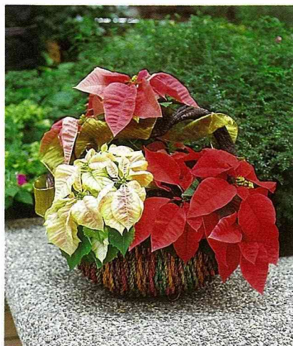
不同花色的聖誕紅組成趣味的擺飾，又是高貴不貴的花禮。