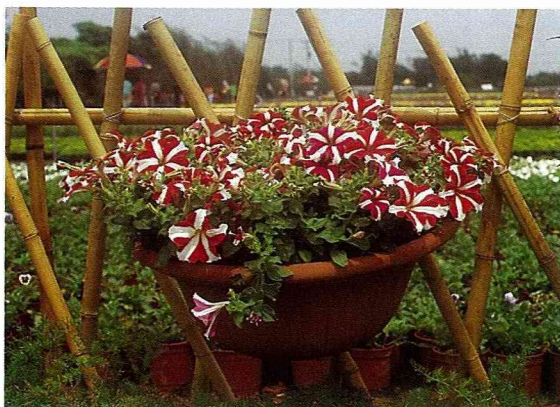
條斑矮牽牛，單植在大型的吊籃中，與花盆上的條紋互相輝映，簡單中充滿趣味，是不需設計、很簡便的應用。