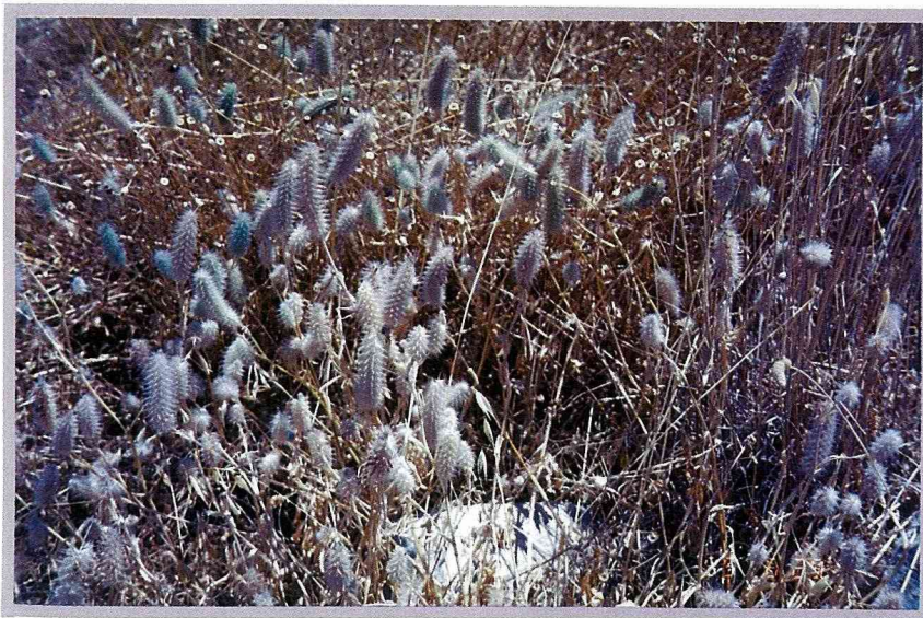
遍地自然乾燥的野花

希臘的夏季漫長且炎熱乾燥，每年4月到10月，天天都是陽光普照、晴空萬里的好天氣，在這優渥的氣候裡，自然成爲世界乾燥花的寶庫。