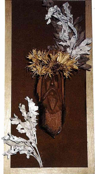
希臘風味的乾燥花壁飾

感動，彷彿自己就是這神秘環境中的女主人，把最喜愛的乾燥花，自由自地在教堂裡發揮、裝飾，這是否會是世界上最美的王國？