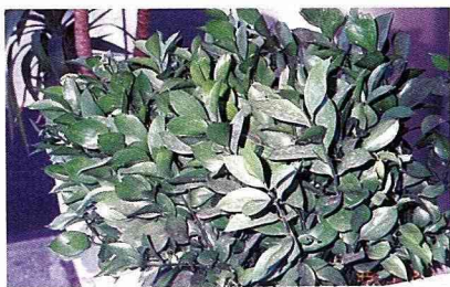
假葉樹在雅典市區到處可見

碧綠的海色。沿著海岸線約有60公里的濱海公路，在此地瀏覽風光是如此地令人心曠神怡。海神普賽頓 (Poseidon) 神殿，建造於西元6世紀，在此遠眺日落時分的大自然景色是相當美的，因此為數甚多的觀光客經常到此觀光，我們也是從台灣來的其中之一。