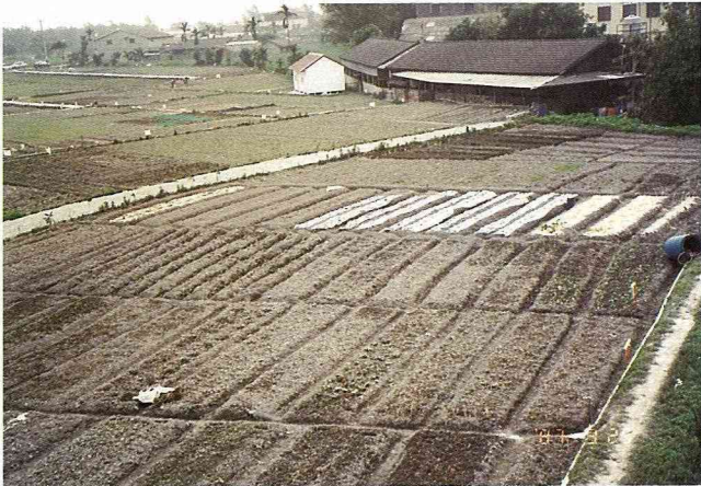
承租人耕耘作畦，開墾屬於自己的田園。