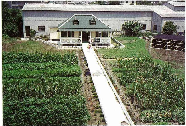
隨著作物的生長、環境的綠美化和休息設施的建立，豐原市市民農園已頗具規模。