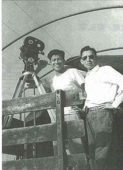
黃顧問(右)與紀錄片攝影師。

業餘專長之一，當年糧食局有紀錄片也是他負責推動完成的。糧食局50年間凡是大小人物、老舊建物，在黃顧問的“資料庫”裡都找得到。