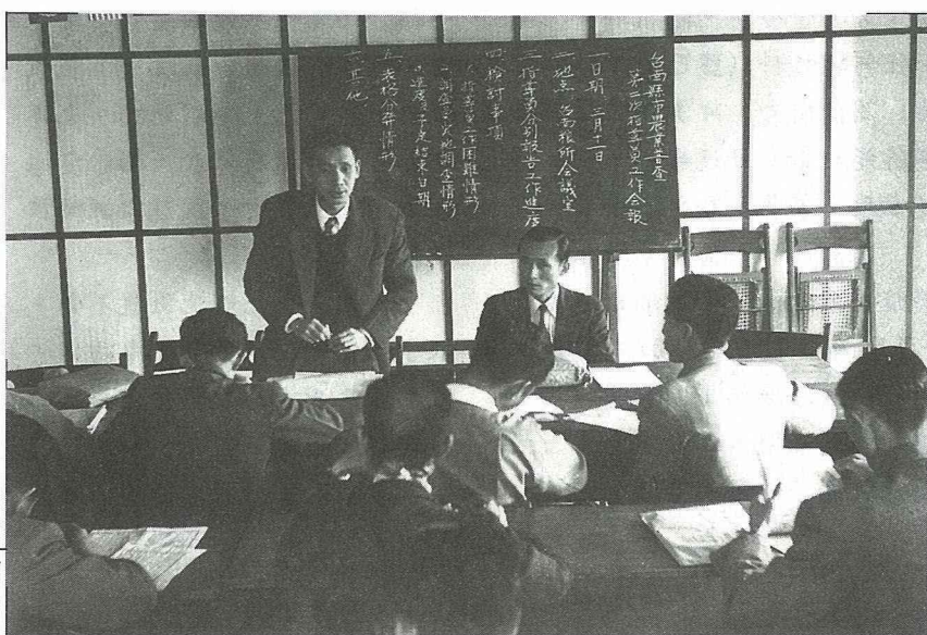
民國45年舉辦全國第一次農業普查，圖中左者為黃顧問。

音響組合是一門學問，端看室內齊全的裝置，都是經年累月的結晶，這是黃顧問的業餘專長之二。以上兩項特長是當年工作所需，今天卻成為閒暇的寄托，依然可以全心的投入，不僅可專心，也可開懷，黃顧問在福中惜福，那會不健康？怎會不快樂？