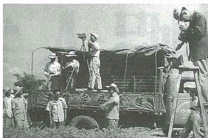
民國45年糧政紀錄片拍攝現場。

向健康、快樂的長壽長者請益“養生之道”，多少有些尷尬，他們得費心思索往日到底如何