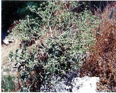
石縫中迸出的藍花松毬草。

嘉那卡利（Anakkalz）是達達尼爾海峽旁的古老港口，第一次世界大戰時，土耳其士兵與英法聯軍血戰，約有25萬人英勇殉難，在到嘉那卡利的沿途，我又看見了更壯大的乾燥花原。幾天來由於配合團體的活動，未能停車採集花材，只有眼睜睜地看著大片、大片的乾燥花隨車窗外風景飛逝。終於，我忍不住地向夥伴表明自己對乾燥花有著濃厚的興趣，並已從事研究10多年，此趟旅行中豐碩的乾燥花材真是