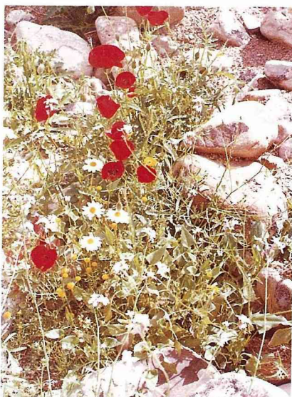
古都爾沙近郊到處都是現成花材。