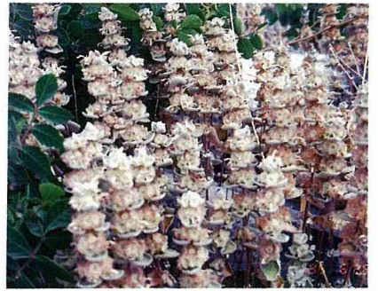
形狀怪異的夏枯草。

土耳其另有一個值得一遊的古城——特洛伊城。特洛伊城最著名的歷史遺蹟就是「木馬屠城記」，除了這一段可歌可泣的歷史外，還生平第一次看到整株的藍花松毬草。在台灣，它是屬於