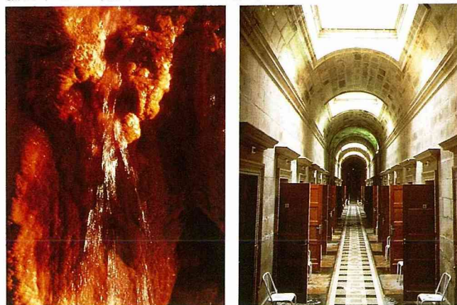
某些溫泉站有時會有奇特景致。老式溫泉中心內部一瞥。此乃因溫泉的礦物質特別豐富，因而產生自然雕塑物。