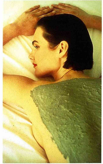
背痛嗎？有時溫泉水的膏泥，就可解決您的問題。

深約4公尺，寬約8公尺的岩洞，散發出硫磺水特有的腐香，有兩個半閉著眼的沐浴者，從頸部以下浸泡在這熱滾滾的一大片水中，好似沈浸在青春之泉般的快意滿足。