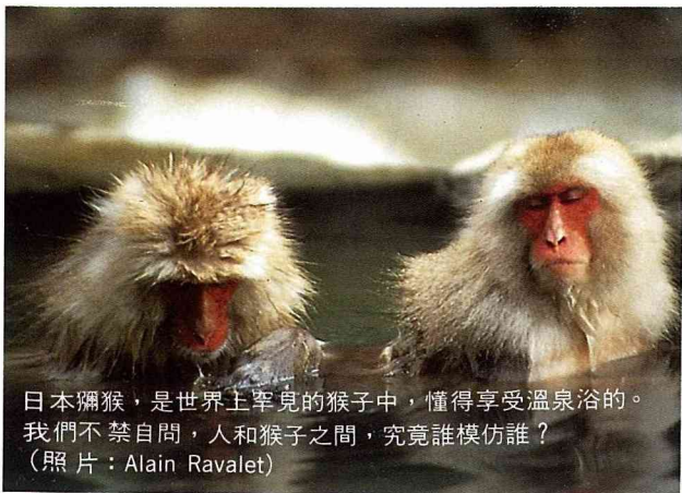
日本獼猴，是世界上罕見的猴子中，懂得享受溫泉浴的。我們不禁自問，人和猴子之間，究竟誰模仿誰？

今日巫師神秘的權能已不足以開發出溫泉。因為水的療效，人們已將之研究成為一門科學，並且是收入來源。以俗士的眼光來看，水這般普通的物質，竟能成為如此吸引人的東西。但根據礦化程度強弱或特別不同品質的水，可提供醫學上各種效果甚佳的療效，可治療12種左右的疾病。其中包括從小孩的發育不良到風濕病。因此溫泉療效的屬性，必須被妥善正確地運用。法國政府自1781年起，決定所有發現溫泉的地主均應向醫藥皇家公會報告。醫藥公會可前往檢驗，並決定該溫泉之用途。