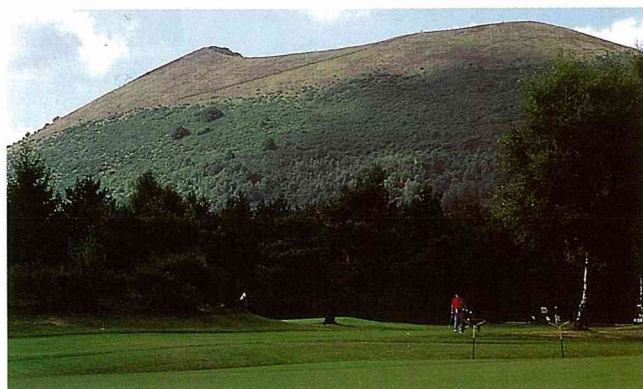
法國中部的奧為尼Auvergne地區。拜火山之賜，成為法國溫泉開發的中心。