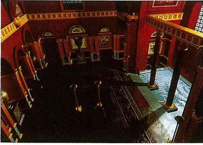
以往在巴黎中心可以找到的溫泉，透過電腦重建出來。