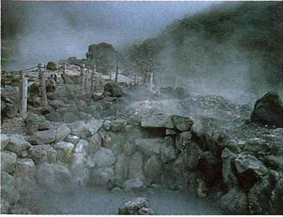
日本山岳，在具有療效的溫泉旁邊，卻有著令人擔憂的岩石和煙霧。