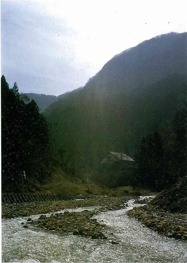
日本一個座落在陡壁中間的峽谷凹陷處，兩步之遙即是溫泉 (onsen)。

名，建了幾個溫泉站，但也是為了使城市裡各個階級的人民因而更親近。在奢華地鋪滿大理石、壁畫、嵌鑲畫和雕像的羅馬帝國公共浴室中，品嚐恩澤，對侵略者而言，是征服人民羅馬化的絕佳方法。