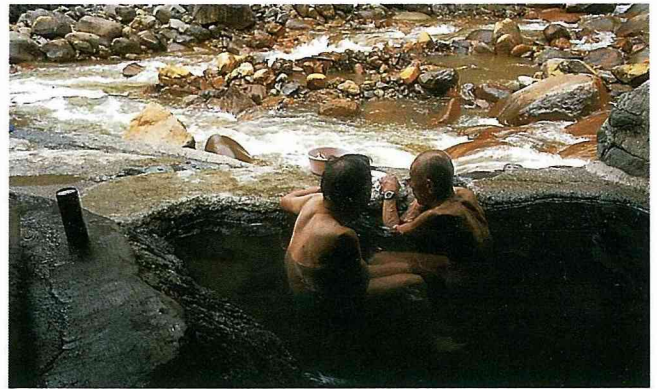
日本人由衷地說，他們最喜歡的三大活動是：工作、清酒和溫泉浴。

期的活動而來。特別是地中海盆地，因地殼收縮造成一些裂縫，成為溫泉出現的理想地方。溫泉利用，今日也在奧地利、瑞士、巴爾幹半島、高加索山脈、義大利、德國、阿爾及利亞、突尼西亞和摩洛哥等地施行中。