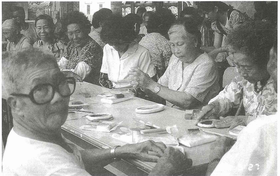
■趣味課程 ---- 阿公、阿媽動手做紙粘土