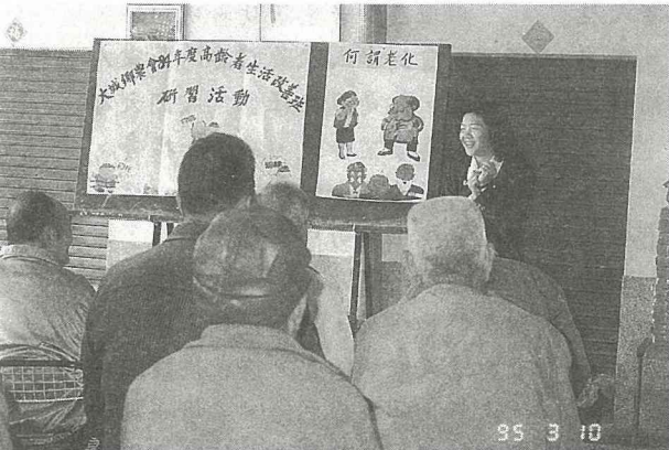
■知性課程 ---- 教導老人預防保健常識

●有的老人過去從未做過身體檢查，也未曾有專業人員教導如何預防保健知識，現在覺得有人關心