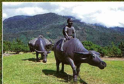
■大草原上動人的農村氣息。

讓人身心舒暢的開闊大草原，詩意盎然的曲橋瀑布，悠遊其間採水果、識藥草……喚起塵封已久的田園心，一圓桃花源之夢，就在兆豐平林休閒農場。