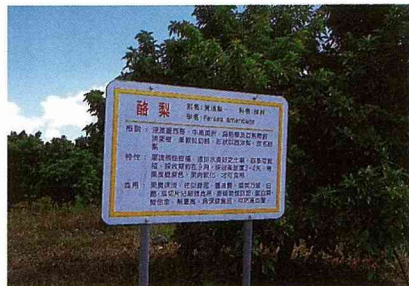
■採果寓教的解說牌。

在70公頃的牧草地上，飼有約250頭大小乳牛，日產乳量約1,500公斤，生產的牛乳純淨無污染，未來將計畫成立一座製乳廠。據說，這些乳牛頗有音樂細胞，只要一聽到樂聲響起便會自動排隊進入擠乳區，供應新鮮好喝的牛乳。除了品嚐鮮乳外，農場也會安排專人解說乳牛的生態習性及飼養方法，遊客也可以親自哺乳仔牛，充當奶爸、奶媽，享受哺乳的樂趣，在知性與情感交流上獲得充分的滿足。