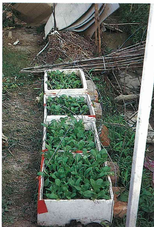
徐先生說在避風處先播種再移植，菜苗可免受風害。