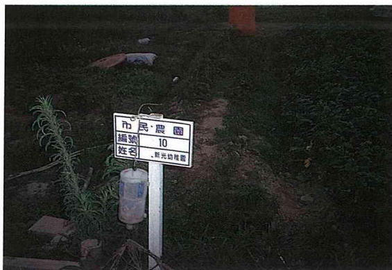
農會鼓勵承租人以生物防治法防治害蟲。

來市民農園耕種的收穫有些是物質上的，有些是精神層面的，但不論是有形或無形的，都讓你有一個屬於自己的空間，可以讓你自由地發揮，不論你投入的是什麼，這片土地都會給你誠實的回報。