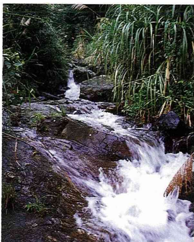
■樹湖溪全由岩石堆積而成，地形變化多端，流竄之間的是超標準的礦泉水。

樹湖瀑布位於壽豐鄉樹湖村，樹湖沒有湖，而是因樹多而得名。由於瀑布隱藏於蓊鬱樹林間，長久以來不但花蓮人鮮有知之者，就連當地民眾也一問三不知。由於人跡罕至，樹湖瀑布更能保持其清純之美，最適合於假