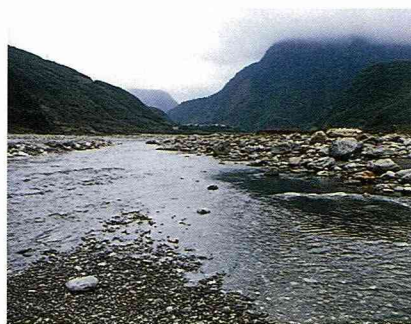
■木瓜溪河床寬廣、水量豐沛、水質清澈，是後山奇石的故鄉。