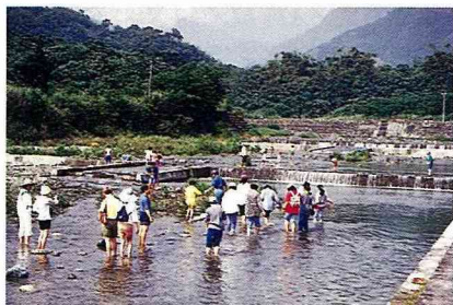
■白鮑溪是炎炎夏日最佳戲水去處。

白鮑溪除了水量豐沛、水質清澈外，河中更蘊藏有種類數量皆豐富的寶石礦，不論戲水、垂釣、摸蝦、尋寶、烤肉都能自得其樂，拜訪鯉魚潭再至木瓜溪、白鮑溪享受濃濃的戲水情，壽豐鄉的戲水之旅就更不虛此行了。