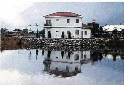
■富麗漁村洋溢著水鄉澤國的清麗風貌。

有興趣到壽豐戲水可以從南華穿越鐵路地下道走舊的花東公路先到木瓜溪再至鯉魚潭、白鮑溪，然後沿花東公路行至豐田右轉經精鐘廟專後的鄉道走約2公里見一座二號橋，橋下即是樹湖溪。回程可以由壽豐加油站前約200公尺處的路口往東行參觀富麗漁村、怡園老樹安養中心，然後經月眉大橋，由西側產業道路回花蓮市。結束快樂的水鄉之旅。