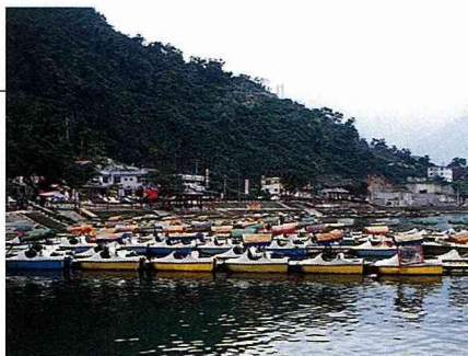
■鯉魚潭經規劃整治後，面目煥然一新。

到鯉魚潭遊玩，可以泛舟、垂釣、爬山、散步、還可以在設備完善的露營區露營，並且享受活魚三吃、活跳蝦等美食，儼然