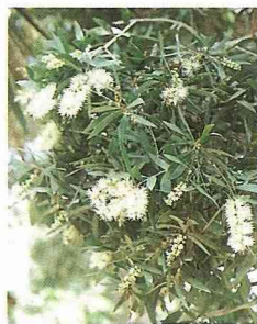
■白千層開花的樣子。