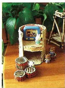
■遊戲時屋頂拿開，所以不做屋頂也可以。

如果覺得困難，先作一個一層樓的就容易多了，缺口只要剪成門形，也可不做屋頂，一樣可以玩得很開心。要更精緻些，可以鏤空做一些門窗，或用色紙剪一些門窗的形狀貼上也行。 [圖]