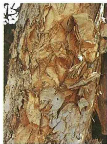
■白千層的樹皮綻裂成一片片，很容易剝落，用剪刀就可以剪成想要的樣子。

倍，剪掉四分之一或五分之一，用膠紙粘成椎狀，外面在用白千層樹皮剪成魚鱗片，由下往上貼。曬乾後就完成了。