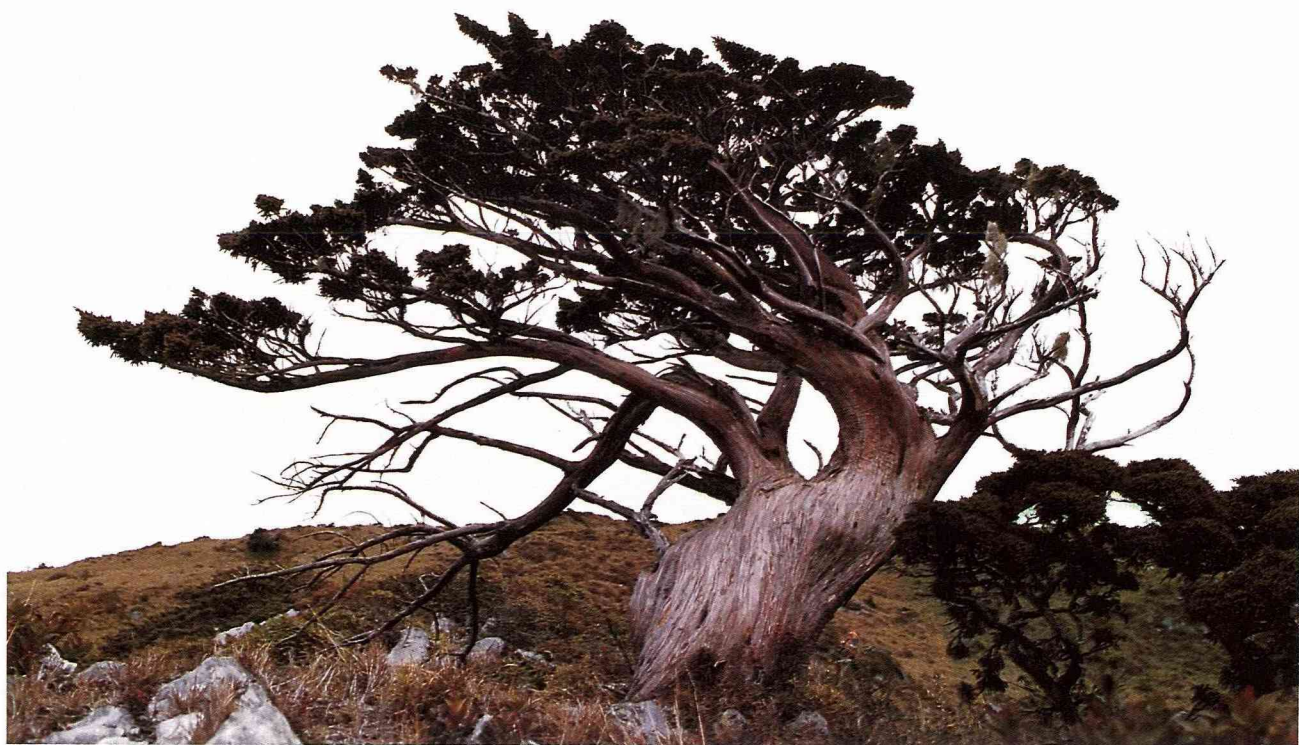
■向陽山·玉山圓柏。

森林是水的故鄉，水是森林的保姆，造林季節最好有充足的水份，樹苗才容易成活，可是這是可遇而不可求的。深山造林是一件艱苦的事，有時為了趕進度，常常一連幾天必須在山野裡露宿。台灣山嶺陡峭有名，在山裡要找一塊平坦的地方容身躺下亦非易事，有時得利用一些溪谷乾河床來紮營。曾經有一支造林隊在半夜裡遇到驟雨，山洪暴發。全體人員在山壁下半身泡水到天明，沒有被大水沖走已算萬幸，但雨過天晴後他們仍得繼續