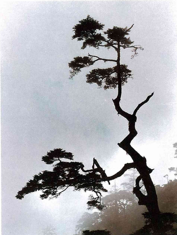
■南橫公路·台灣鐵杉。

自從政府開放森林遊樂區之後，山區的交通食宿條件大幅改善，吸引了不少民眾上山旅遊。大家都能享受到清新的空氣和林間有益健康的芬多精，青翠高遠的山景也能讓人心胸寬暢，不過大部份人都是走馬看花來此一遊罷了。筆者很幸運有認識三四十年的老朋友在那裡服務。每次上山由老友充當義務解說員，都能增加一些林木或生態方面的知識。例如如何辨識紅檜、肖楠或