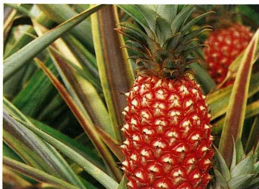
■色澤鮮紅，瞄準新新人類市場的台東紅鳳梨。

還 記得鳳梨的代名詞「旺來」嗎？鳳梨除了主要供給人們食用外，也是拜拜應景的水果，以往農民供應市場的拜拜鳳梨多是留鳳梨尾，還未長大可食的鳳梨，時至21世紀的今天，連專為拜拜用的鳳梨品種也被農友開發出來了。