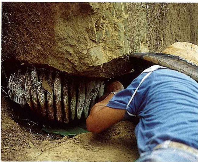
■採收野蜂巢蜜，補充營養。

在30天後，安然返回家園過著幸福美滿的生活。因此，久而久之，被人們稱為「度蜜月」，後來演變成爲新婚度假的代名詞或叫做「蜜月旅行」。