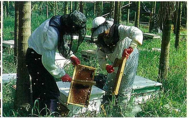
■驅逐蜜蜂，準備採收蜂蜜。

後的第一個月，這期間除了溫柔和喜悅之外，別無他物。您說新婚夫婦既有了溫柔和喜悅，還要他物做什麼呢？但是也有人這樣說：新婚生活甘美如蜜，所以才叫做蜜月。蜜月最甜美，讓人難以忘懷，為人生四大樂之一（久旱逢甘雨，他鄉遇故知，洞房花燭夜，金榜題名時）。因而日常生活中常引申為合作雙方最和諧最親密的關係。