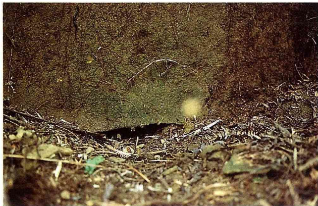
■築巢岩石縫內，野蜂於出入口進出。