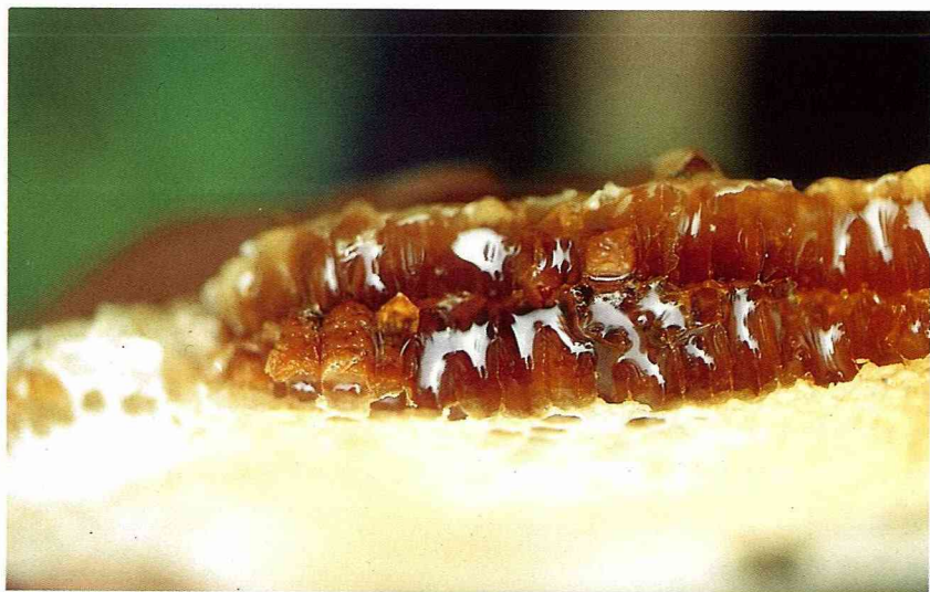
■人類最早利用的天然食品：蜂蜜。

牛津字典上說：新婚夫婦度過的假期叫蜜月。意思就說，蜜月是新婚夫婦進入正常家庭生活前的一段快樂而難以忘懷的假期。約翰生博士則稱：蜜月是婚