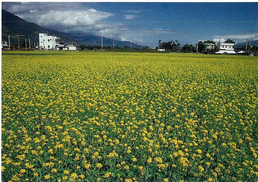
■冬季裡作綠肥一油菜，提供蜜蜂採集蜂蜜和花粉。

綜合上項不同時間、空間和背景，敘述蜜月由來之後，獲得了結語，那就是：（一）瞭解蜜蜂與人類淵遠流長的生活關係，造就了無數幸福家庭。（二）當作不死、再生、活力和婚姻生活甜蜜的象徵。（三）引申各項和諧親蜜關係。（四）代表勤勞與團結合作精神。（五）提供增進體力，振奮精神的泉源。（六）蜂情萬種，濃情蜜意。（七）一切愉快的事情。（八）蜜月期飲用蜜酒。（九）婚宴上招待蜜酒可顯其樂，暢其懷。 ㄟ