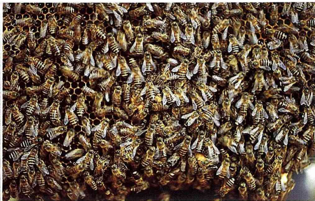
■群聚自然巢片上的野蜂。