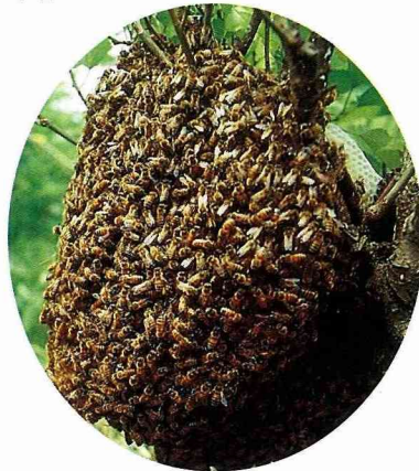
■意蜂分蜂後群居樹幹，結成新蜂巢。