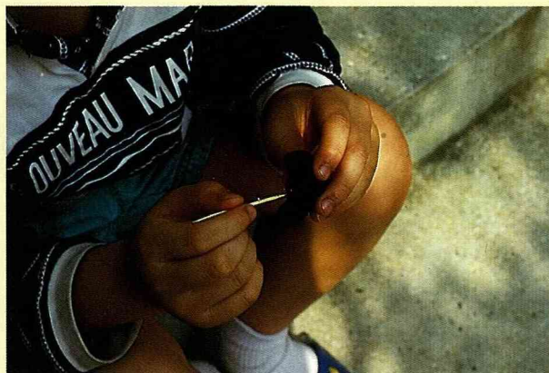
■只要一個老菱角和一支牙籤，就是全部需要準備的材料。

秋 天一到，雖然還沒刮起涼颼颼的秋風，但是一看到豔橙色的紅柿和深絳紫色的熟菱角，一起出現在水果攤時，秋天的味道好像不自覺的飄散出來，叫人難忍先嘗為快的衝動。尤其是熱呼呼的菱角，不吃不可，好像變成每年秋天牢不可破的習慣。可是菱角原來屬於熱帶的水生植物，倒成了秋天的表徵。