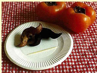
■用牙籤耐心的把菱角仁由頂端掏出。

本省菱角多產在嘉南、高屏地區，坐火車一過關廟，還常常可以看到很多菱角田，採收期多半在9月起至12月。老熟的菱角，澱粉多水份少，煮起來硬實、風味口感均佳。菱角也可以剝出菱角仁，炸成菱角酥甜點，或燉排骨湯、紅燒肉，都非常美味，沒有一個小孩不愛吃。