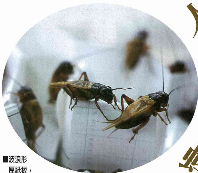
■波浪形厚紙板，提供蟋蟀產卵和躲藏的隱蔽環境。