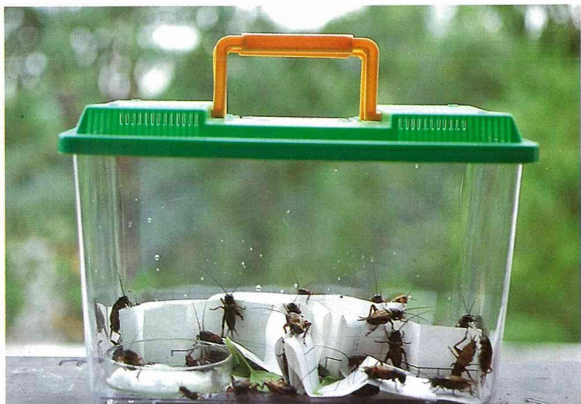
■小小玻璃箱就可布置成蟋蟀窩。

在蟋蟀出現較多的地方，鋪上一些稻稈，並在上面放置一些菜渣或飼料，等蟋蟀聚集起來時，再用網子捕捉，將蟋蟀放置