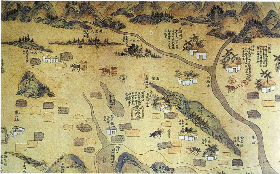
■恆春古地圖上有野牛。

中水牛為 266,190 頭，佔 82%，黃牛 46,960 頭，佔 14%，印度牛及其他佔 4%。水牛用於水田耕作，黃牛用於曳運馱載、屠宰。但是，因為機械製糖的出現，火犁、小火車、蒸汽機大量的取代了原有牛的動力。牛文化於是逐漸式微，百年來，尤其其在世紀末更明顯。