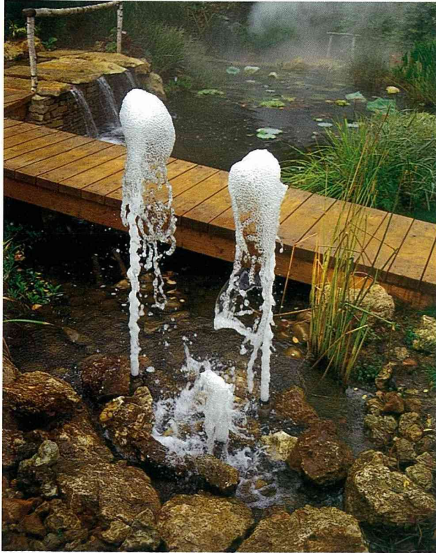
■水下花園。這個花園有瀑布、間歇熱噴泉、霧氣和水生植物集錦。在和諧水流中充滿神秘與平和。