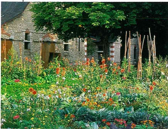
■ 這是較傳統的景緻——城堡水流和蔬果園。(照片：Papyrus)。