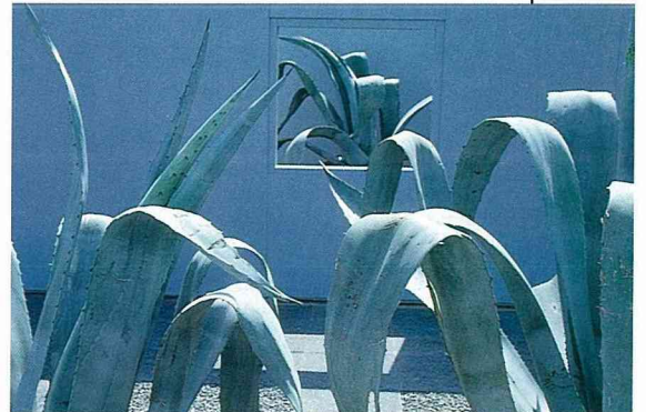
■某些花園的創作者致力於獨特色澤的表現。在構思這個龍舌蘭花園時，乃是本著凸顯灰色的榮耀，其中根據材質不同而配合上深淺不一的灰色調，像是龍舌藍的灰綠樹葉、淺灰水泥牆或深灰色鵝卵石等。