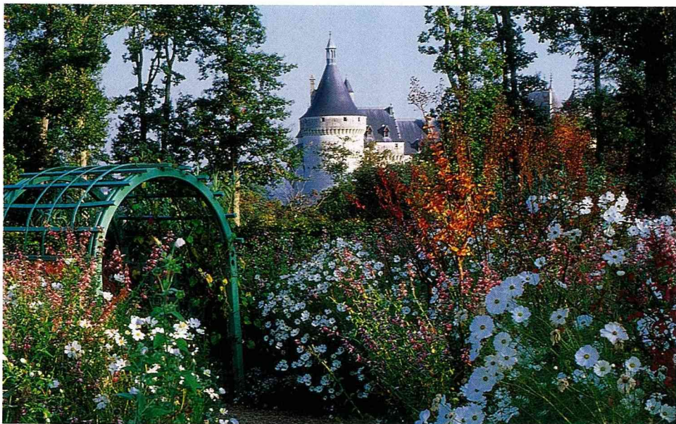
■羅亞爾河畔的 Chaumont 城堡，建於 16 世紀的古堡，如今 是最前衛和充滿驚奇 的園藝競賽勝地。