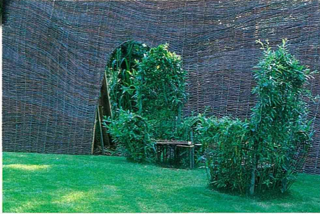
■ 這是個夢幻花園，傢具(桌椅)好似都融入花園景觀中，傢具也都添上新葉。