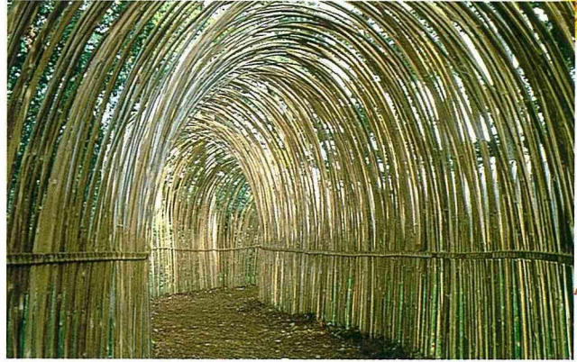
■又是日本精神的再現，這是日本大師 Teshigahara 的作品。他是一位電影工作者、插花大師和當代園藝家。這個竹子隧道由於大受群眾喜好，所以連續保留了3年之久。