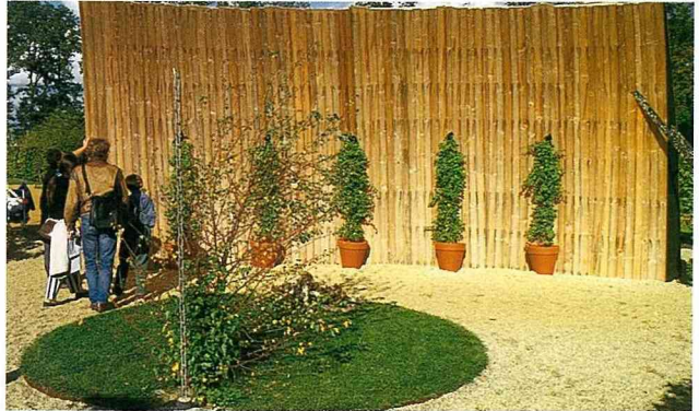
■這是位澳洲園藝家的創作，乍看之下不禁令人咋舌，因為這個花園的風格實在和現行花園太不一樣了。

園藝家以暗示的手法表達和自然協調的不容易。自然在統治人類後，而今卻反過來被人類摧毀。一個被柵欄切割的世界，柵欄上攀緣著盆栽植物，這正象徵著人類馴化大自然的一個優勢。(照片：Alain Ravalet)。