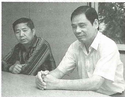
■桃園龜山鄉農會莊總幹事（右）是推動市民農園的先驅人物。

建設的構想之一，現在相鄰的桃園、苗栗縣都已在辦理，新竹縣反而落在其後，自費也應獲得中央的支持辦理。