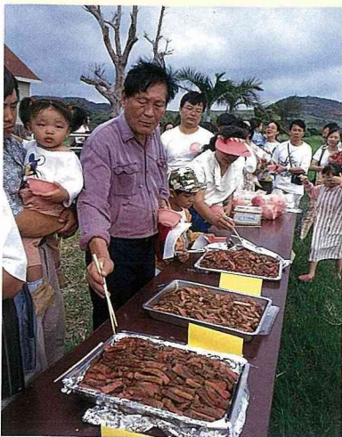
■ 品嚐牛肉，大塊朵頤。