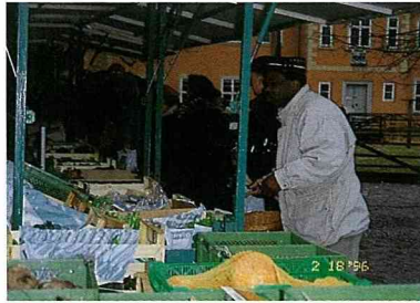
圖 8 & 9 有機農產品週末市場。