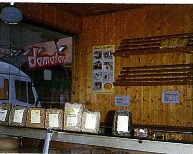
圖6. 有機麵包及穀物攤位，此農場屬 Demeter 有機農業協會。

除了雞蛋及蔬果外，該市場還有麵包、乳酪、肉製品等攤位。天氣好的時候，許多有機農產品市場的固定客人或博物館的訪客會在此享用附設商店所供應簡單的有機農產品午餐或茶點。除了每週一次的有機農產品市場外，博物館也舉辦與農業或農村社會有關的各種展售會，例如今