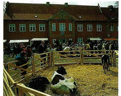
■ 農業博物館及多姿多采的活動。