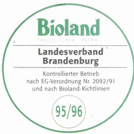
圖 3. 有機農業協會之標示。

博物館的管理單位為使該市場能穩定發展，對擺攤售貨者亦加以篩檢。其中只有一位已退休的有機農民不再自己生產，而以運銷商的身份出售其原農場及附近有機農場的產品與部份進口品，其餘皆為實際生產的有機農