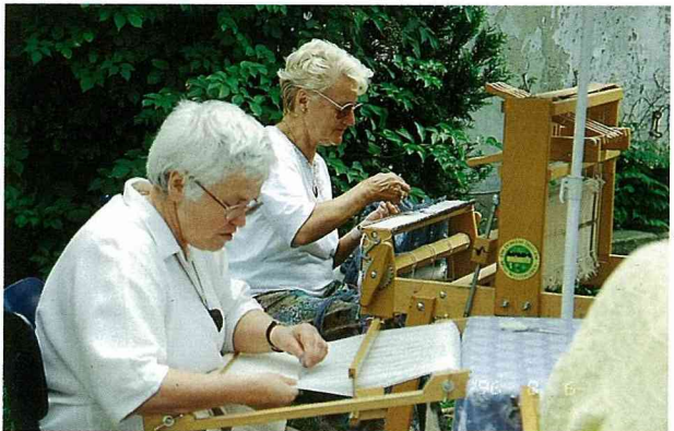
圖5. 手織布社團，婦女們樂在其中。