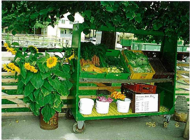
圖4. 博物館附設小店，出售該有機農場所生產的花卉。

許多歧異。柏林位於德東地區，是與原東德最接近的都市。博物館每次展售會的銷售者多來自德