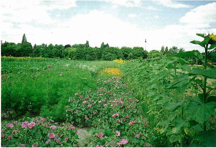
圖 2. 農場多樣化的作物種類。

這個博物館認為，有機農業是一種最現代化且最值得推薦與介紹的生產方式，因為它不污染水土及食物，又注重生態平衡。因此在經過多年的嘗試與實踐之後，該博物館於1995年向德國最大的有機農業協會Bioland申請加入為會員，一年後，經過檢查與考核，他們目前已經是正式的會員，所生產的農產品可以貼上該有機農業協會的標示出售。目前，農場內種有馬鈴薯、各種穀類及牧草。為加強土壤肥培管理，他們非常重視輪作及綠肥作物的種植，且將多種綠肥及可用