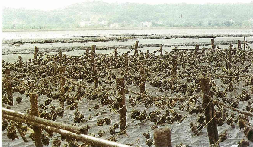
■ 養殖大牡蠣是西部潮間帶上的一大特色。

砂泥灘地廣布於臺灣的西半部海岸，不但是人們享受親水、弄潮及灘釣的地方，棲息於此間的水產生物更可吸引人們去觀察瞭解，或是採捕及利用，其中，砂泥灘地的雙殼貝類就是一個很好的例子。例如我們常吃的蚵仔煎，是來自養蚵漁民辛勤採收；清淡爽口的蛤仔湯，則是需要用耙具賣力從沙泥地挖出來的。所以，認識潮間帶砂泥灘地的貝類，不但對於野外自然生態的博物學多了一項了解，也可明白我們日常生活中的食用性貝類究竟是從何而來？