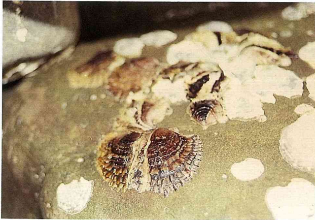
■黑齒牡蠣附著於石塊上，肉質鮮美甜嫩。

楔形，右殼較平較小，其上有波浪狀排列的稀鱗片；左殼則較大而稍凹。殼面為淡紫色、黃褐色及灰白色相間。棲息潮下帶至水深 10 公尺海中的蔽體上，主為漁民養殖的對象，所以產量甚多。殼長約 8 公分。