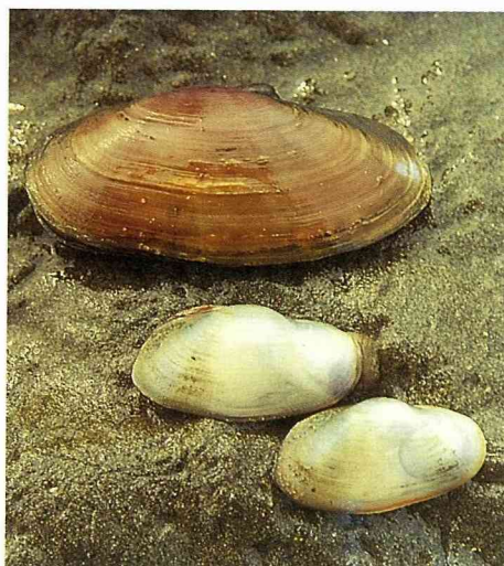
■西施舌(上一)與公代(下二)也是常見的雙殼貝類。

綠褐色或黑褐色，並有細緻的生長輪脈，內面則具亮麗光澤。棲息地主要在紅樹林灘地或近河口的石頭縫中，並以淡黃色細長的足絲附著於殼體上。殼長約11公分。