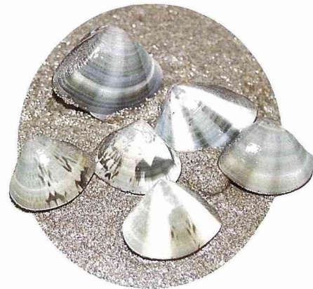
■花蛤光滑的表面有相當多樣化的紋彩

潮間帶的雙貝類是具有高經濟價值的水產物，也是大多數人鍾愛的海鮮美食。到西部砂泥灘潮間帶進行生態知性之旅的同時，一方面可以找尋和認識牠們，一方面也可以有限度的採捕利用牠們，例如依據台灣省漁業管理辦法第 28 條規定，蛤類及西施舌殼長未滿 3 公分者禁止採捕，所以在幼貝尚未長成時，切不可恣意濫捕而破壞資源。若進