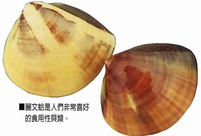
■麗文蛤是人們非常喜好的食用性貝類。

黑齒牡蠣 ( Saccostrea mordax ) 俗稱石蚶，也屬於牡蠣科的種類。形狀為圓卵形或楔形等不規則狀，額緣有紫黑色波浪狀或齒狀的構造。棲息於下潮帶的區域中，並以左殼固著於岩礁或蔽體上。天敵為肉食性的蚶岩螺 ( Thais clavigera )。人們