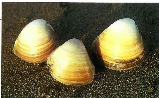
■黃文蛤產量不多，為採補文蛤時所混獲的附屬品。

綠殼菜蛤 ( Perna viridis ) 又稱做綠貽貝或翡翠貽貝，屬於殼菜蛤科的種類。殼呈上平下銳的楔形，殼緣為翠綠色，上半部為