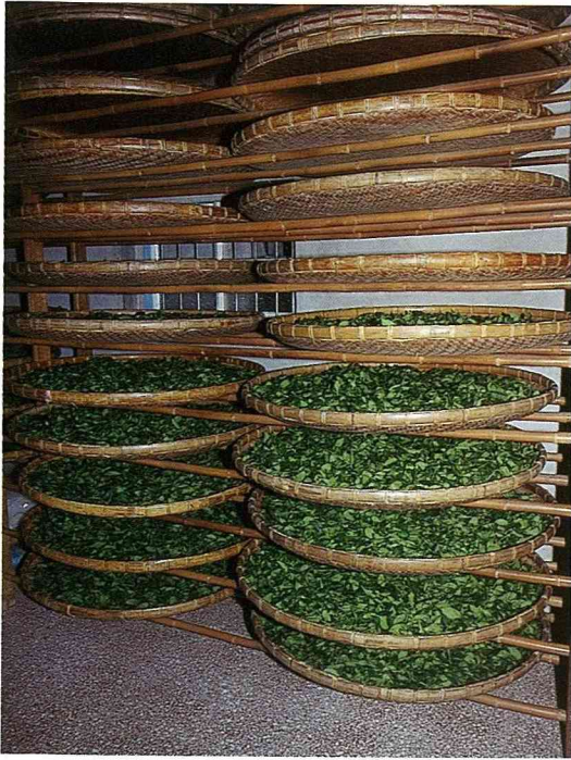
■入夜後看茶農怎樣製茶。