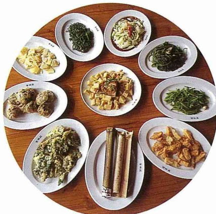
■休閒農場提供地方特色的佳餚。

鳳凰休閒農場的另一個特色，是翠竹滿山盈谷，不是茶樹就是翠竹的天下。「無竹令人俗」、「詩清皆為飲茶多」，有竹又有茶，這是一座充滿詩意的農場。