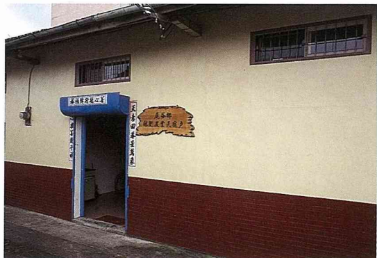
■借住民宿，領略茶山農家生活。