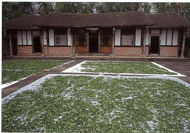
■茶農種茶，自製自銷。

台灣的氣候潮濕溫暖，很適合茶樹的生長，且又因地形有高嶺山谷，終年雲霧縹緲，更是生產品質優良茶葉的地方。因此，早在200年前，便有閩粵地區的移民，把茶種帶到台灣來，一直