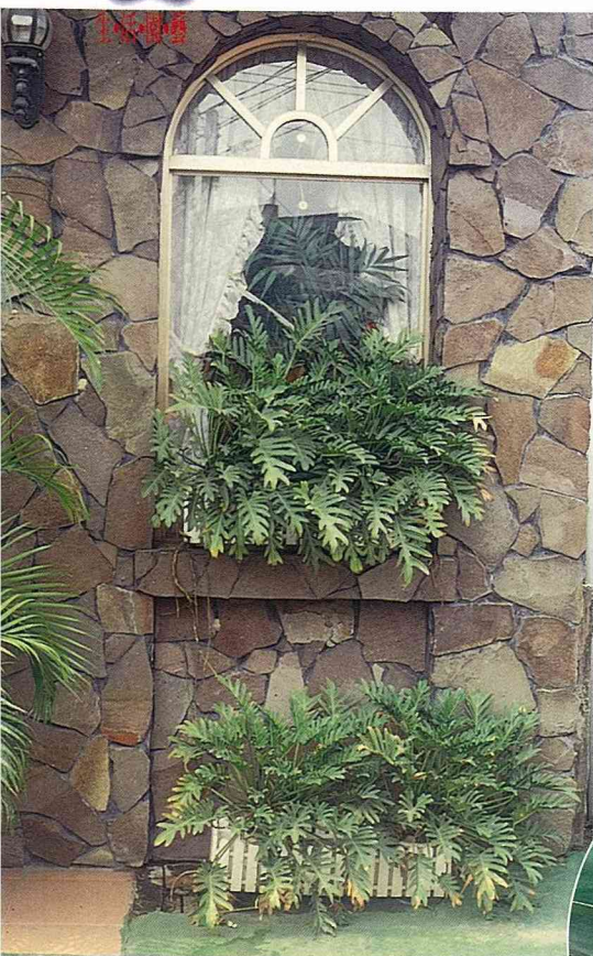
■陽光太強，讓小天使蔓綠絨顯得有些憔悴？