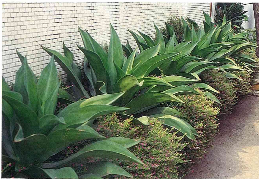
■整排的翡翠玉蘭和綠葉雪茄，形成路旁的視覺焦點。

很清楚，有時儼然是地下情報站，連我們要調查全省聖誕紅盆花產量時，都會私下委請他掐指算一算，估個八九不離十。