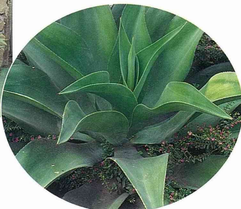
■美麗的巨大的綠色蓮花，讓我忘了一身的疲憊。

輕鬆的辦公環境及場區，而且每個盆子都大，種的東西也都長的很大，是真正的「大大」有意思。