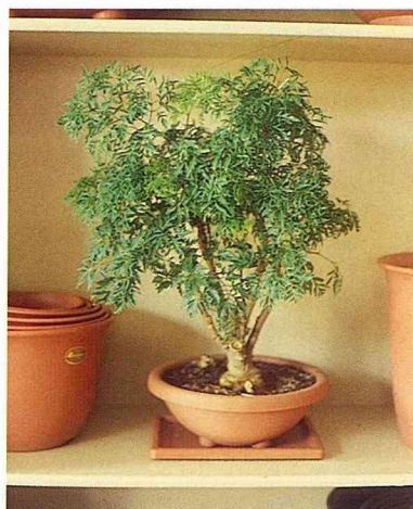
■福祿桐很耐陰，隱身在花盆間，依然健壯。