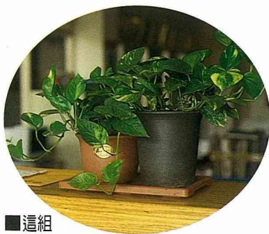
■這組黃金葛是組合 3 種盆花應用的技巧，很高招的！

門口那排漂亮的綠色蓮花是翡翠王蘭，是被副董事長蔡平山相中的，已經種了 3 年多了，的確是越來越美。不過一般花店很少賣翡翠蘭，因為它的葉片實在是太脆了，若在搬運的過程中一不留神有啥閃失，咱的葉片就應聲而斷，而且體積又大又難包裝，很難運輸的。加上消費者很好奇，常常在賣場就忍不住刮刮