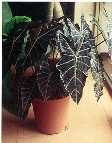
■觀音蓮的葉形、葉色都美，但要費心照顧。