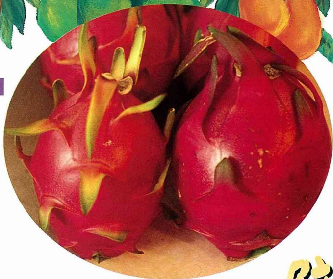
■火龍果美麗的讓人有驚豔之感。

夏末的一個週日早上，抽空到傳統市場補充一些新鮮的蔬果，大概是起晚了，到了市場已是散市，好菜都被挑光了。不禁想起油麻菜子的電影裡媽媽對女兒說，我們家裡窮，買菜要等快散市再去買，才可以買到便宜的菜。我媽媽從來都不讓她兒們當油麻菜子，這招沒有教，而我差點連菜都買到。倒是花了50元買