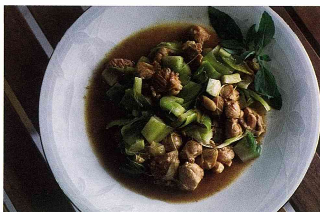
■壁蓮燴雞丁及壁蓮炒蛋，算是我發明的新菜色。

吃，而是比起它的外貌，它的口味吃起來太沒個性了，淡淡的甜。但兒女倒都很喜歡吃，一人分一半，每次都吃的不亦樂乎。吃完了，還把挖空的果殼一起帶去洗澡當小船。它的果皮有一層海棉組織，所以浮力不錯，還可以載一些其他的玩具水鴨子什麼的。