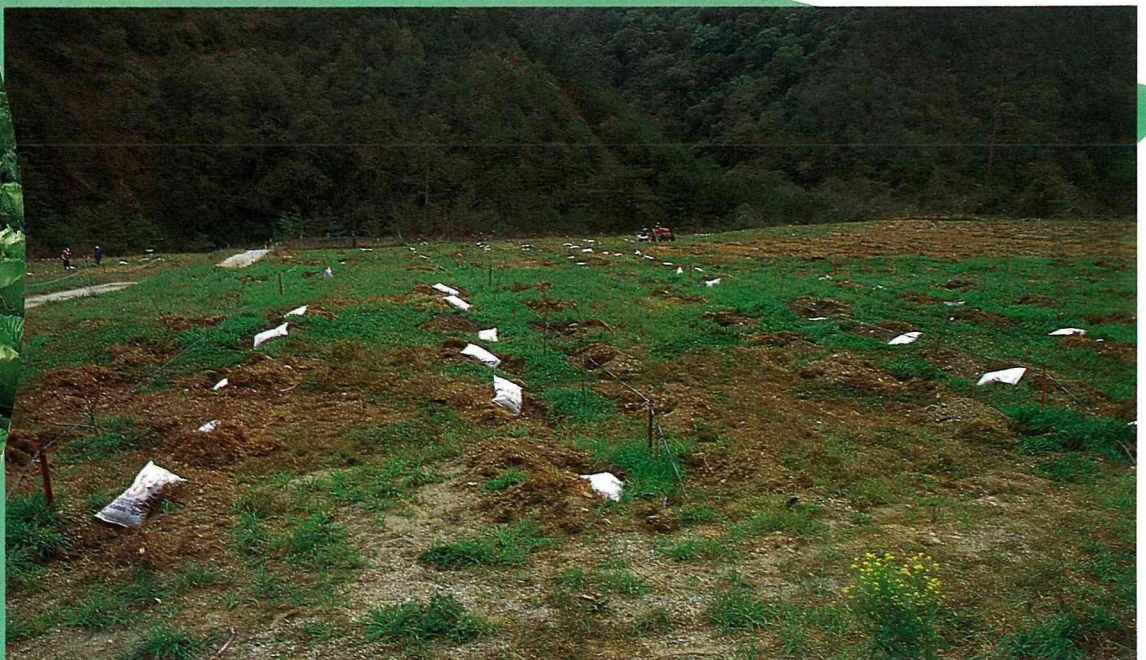
■有機質肥料施肥作業。