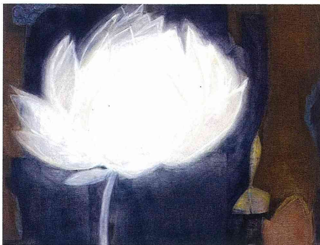
■「荷」是白丰中最喜歡的題材。

白丰中因花卉畫而風格更加確立，花卉因白丰中而讓人窺見了她的內心世界。如果你還沒有看過他的畫，這個