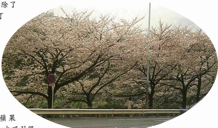
■春天的日本東京都，夾道歡迎的壯麗花海，讓旅人深刻感受到櫻花季的震撼。